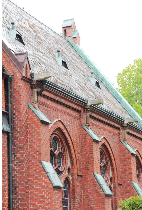
Långhusets södra fasad.