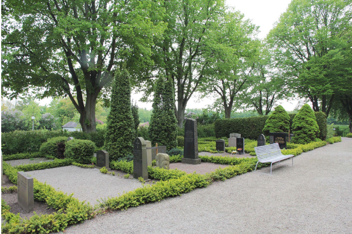
Kyrkogårdens södra del.