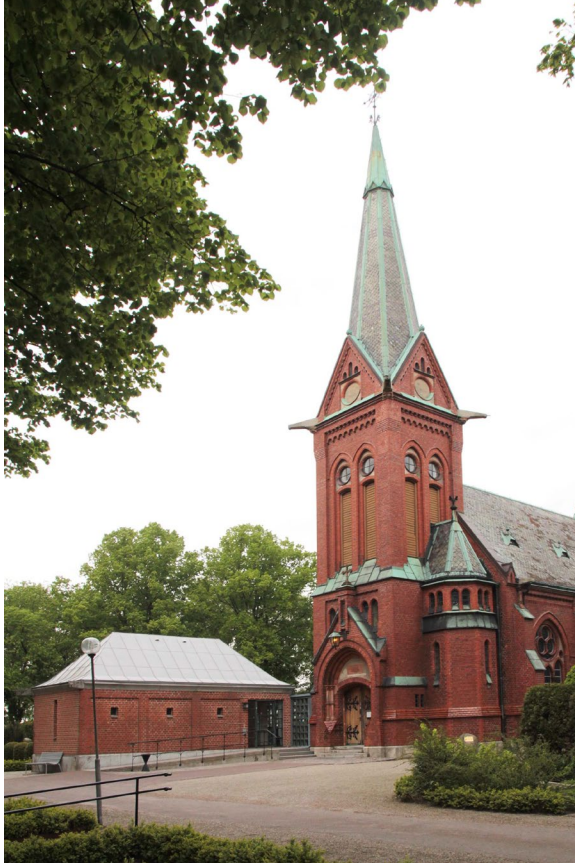
Kyrkans annex uppfördes 1996.