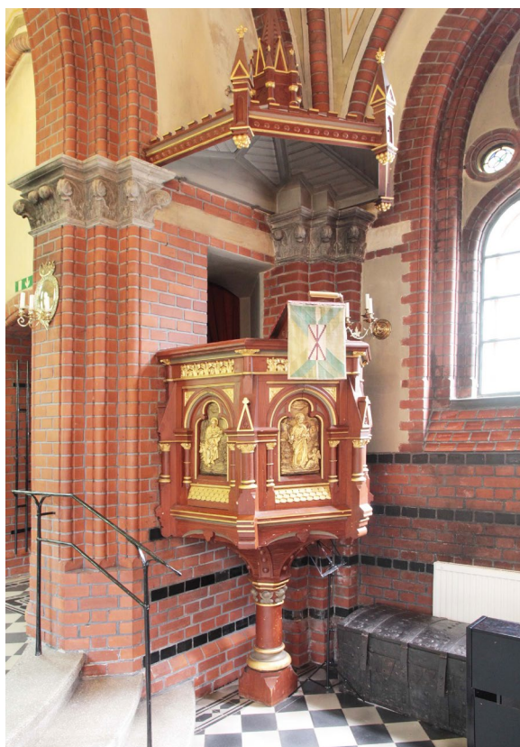
Predikstolen i långhusets sydöstra hörn.