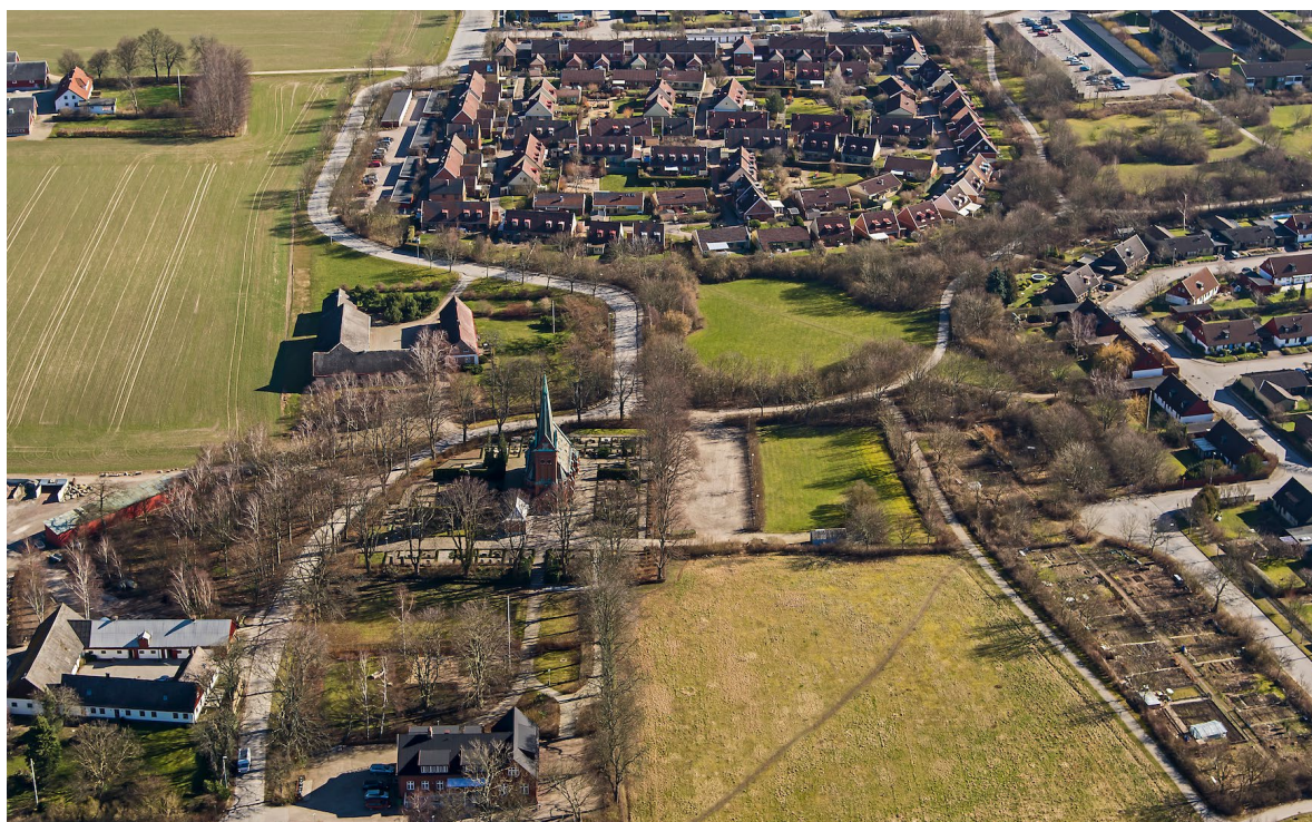
Flygbild över Norra Nöbbelöv tagen 2014.

Arkeologiska undersökningar visar att platsen för Norra Nöbbelövs kyrka varit en vikingatida eller tidigmedeltida bosättning, och sedan dess har området troligen varit bebodd permanent. Det tidigast kända sockennamnet Nyböle har betydelsen ”den nya boplatzen”. Andra namnformer som använts genom åren är bl.a. Nybele, Nøbele,