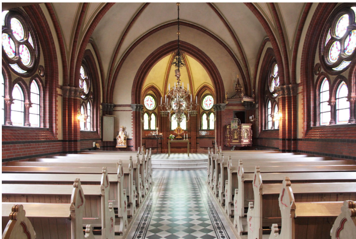
Kyrkorummet sett mot koret.

Kyrkans huvudentré återfinns i tornets västra fasad och leder in i vapenhuset som i norr ansluter till annexet via en stickbågig öppning. Till höger om denna öppning finns dörren till den norra torntrappan. På motstående sida leder en likadan dörr till det södra trappornet, vars bottenvåning idag upptas av ett städförråd. I öster leder en grönmålad pardörr med pärlspontsfyllningar vidare in i kyrkorummet.