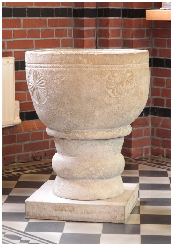
Dopfunten i sandsten från 1100-talet.

Orgeln , med 11 stämmor fördelade på två manualer samt pedal, är tillverkad av Mårtensson Orgelfabrik i Lund och invigdes 1971. Orgeln är inbyggd i kyrkans ursprungliga nygotiska orgelfasad från 1901 vars färgsättning, precis som orgelläktarens, går igen från bänkinredningen. Den ursprungliga orgeln hade byggts av orgelbyggaren Johannes Magnusson i Göteborg. På 1950-talet ersattes den av en orgel byggd av E A Setterquist & Son i Örebro.