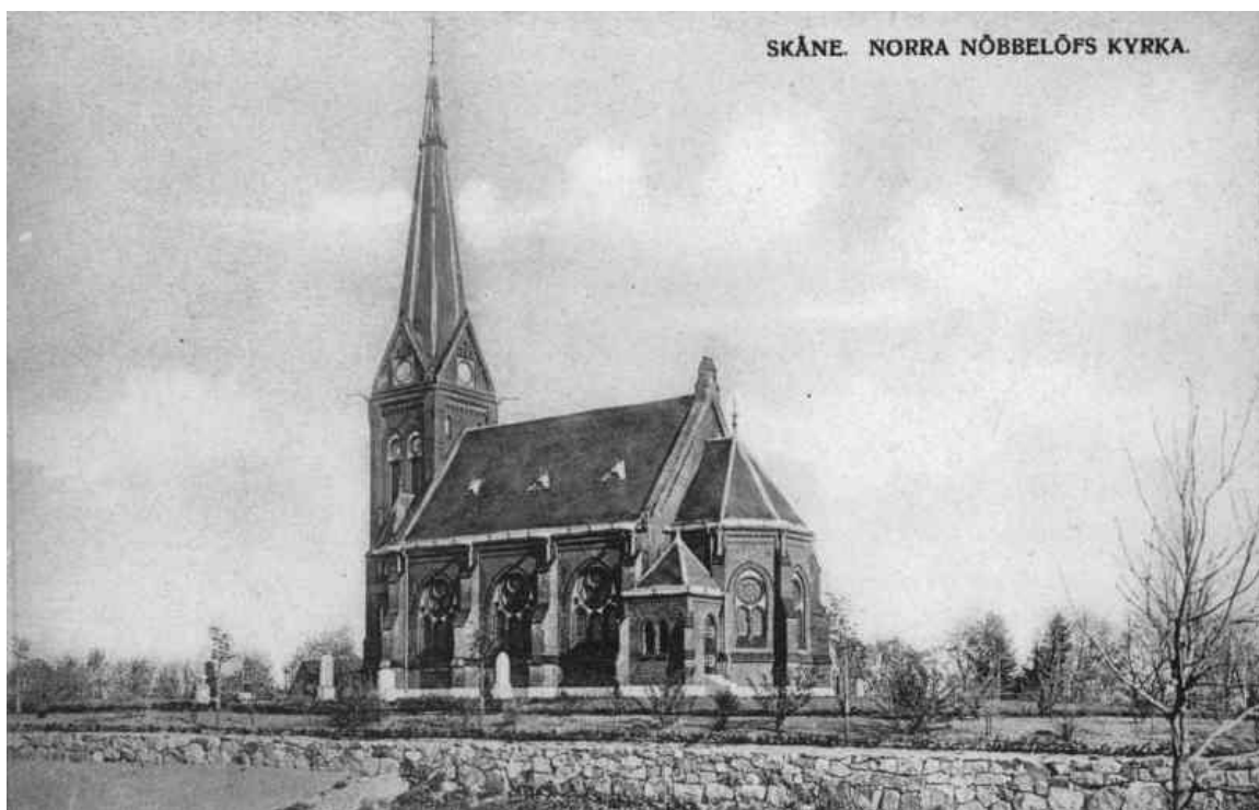
Norra Nöbbelövs kyrka fotograferad vid 1900-talets början.