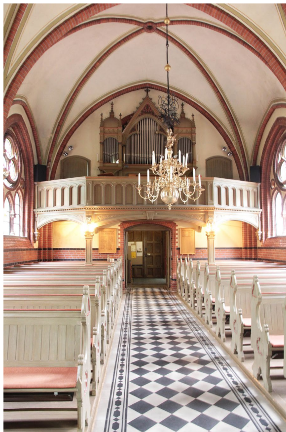
Orgelläktare med orgel i väster.

Mittgången flankeras av två öppna bänkkvarter som vilar på en träsockel. Övriga golvytor i kyrkorummet är belagda med svarta och vita viktoriaplattor i rutmönster med mönstrade friser utmed bänkkvarter och väggar. I långhusets östra del redovisar frisen bänkkvarterens ursprungliga utsträckning, innan bänkrader avlägsnades i mitten på 1990-talet. Vissa plattor, särskilt i frisen, har bytts ut och avviker en aning i kulör gentemot de ursprungliga. I långhusets sydöstra hörn står predikstolen, som nås via sakristian, och i det nordöstra dopfunten.