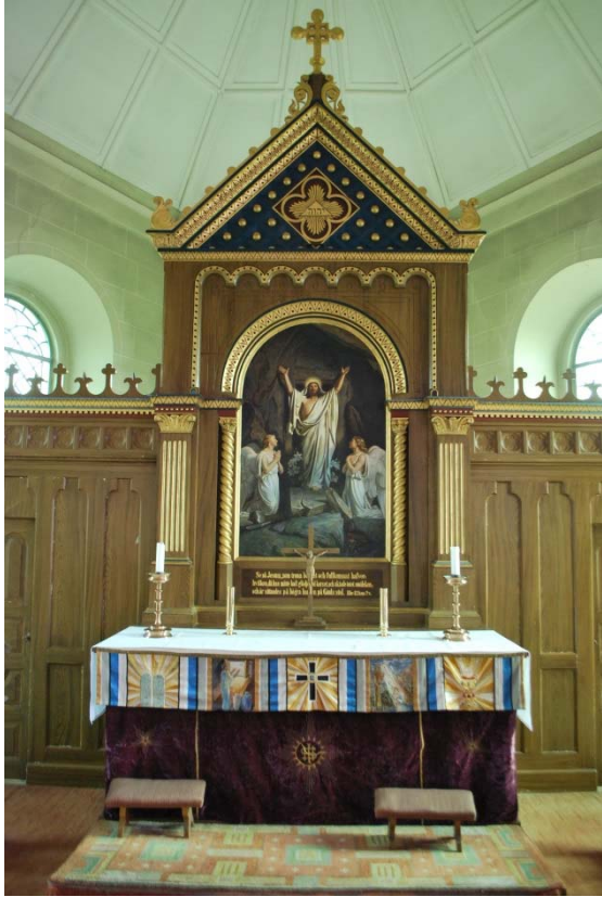
Altartavlan och korskrank.