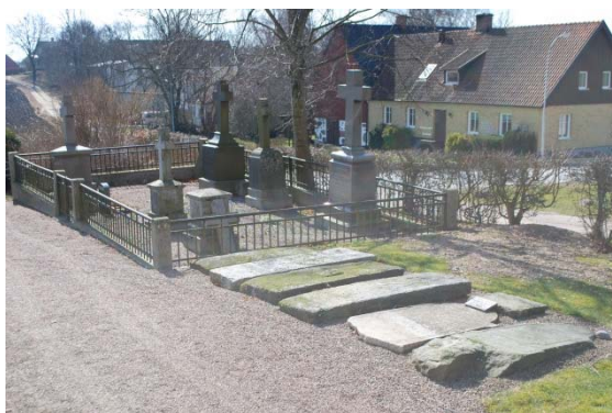
Kyrkogården i sydväst.