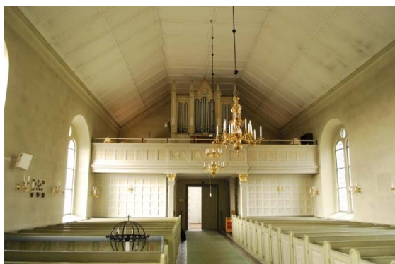
Långhuset mot orgelläktaren i väster.

Ett korskrank med två dörrar avdelar sakristian från koret. Skranket, målat i mörk träimitation, har profilerade speglar och i ovkant en fris med fyrpass inskrivna i en cirkel. Överst finns ett krön av en utsågad uppochnedvänd rundbåge med spetsar av liljor och trepasskors. Sakristian har golv av omålade brädor, tak och väggar är lika långhus och kor. En dörr leder ut till kyrkogården.