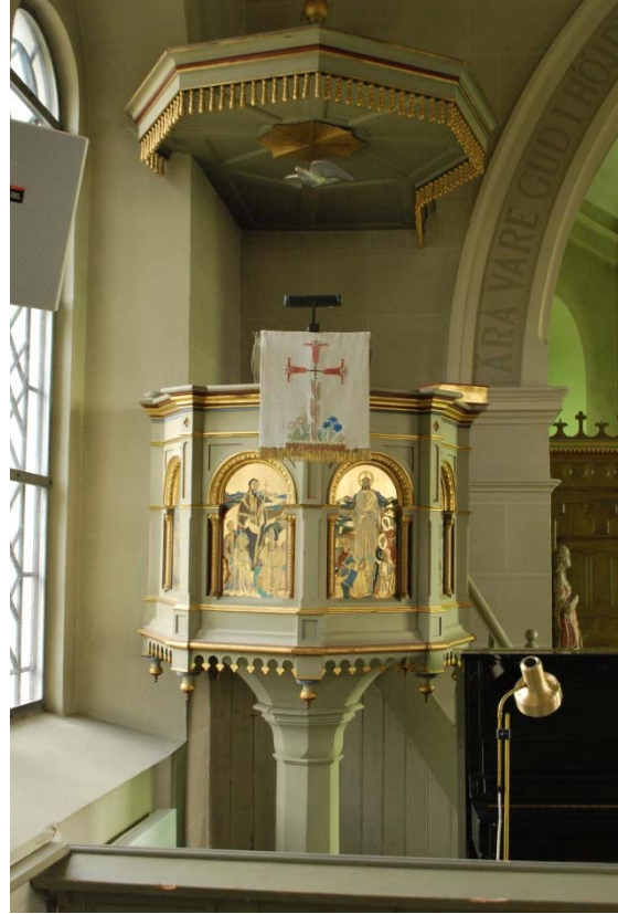
Predikstolen med bilder av Kaj Siesjö.