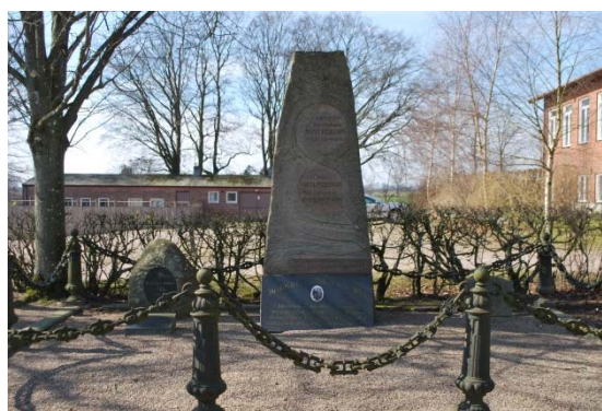
Gravsten med drakslinga.