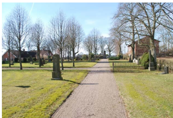
Kyrkogårdens norra sida.

I den nordöstra delen finns en minneslund med en gräsmatta och en mandelformad plantering med en vattenspegel. På en sten finns möjlighet att sätta små plattor med namnen. På norrsidan är nyligen anlagt en asklund bestående av cirklar med plantering med små gravstenar. Norrsidan, den gamla "allmänningen" är för övrigt gräsmatta med silveroxel och enstaka gravplatser. Den utvidgade östra delen avskiljs av klippta och rumsbildande bokhäckar. Här ligger flera gravplatser direkt i gräs utan avgränsning. En urnlund med gravstenar i rad längs rygghäck av bok finns även i östra delen.