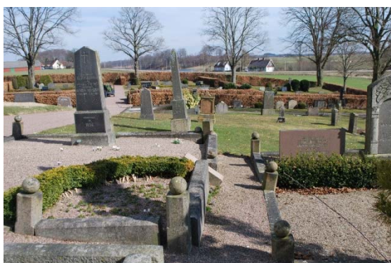
Kyrkogården i söder med stenomgärdade gravar.

Södra delen av kyrkogården som ansetts som den finare delen har ett flertal höga äldre stenar. Ovanligt många är omgärdade av stenomfattningar. Andra gravplatser omgärdas av buxbom eller järnstaket, men flera står numera direkt i gräs. På sydvästra sidan finns äldre liggande gravstenar från 1700-talet.