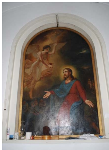
[5]: Altartavla (1828)