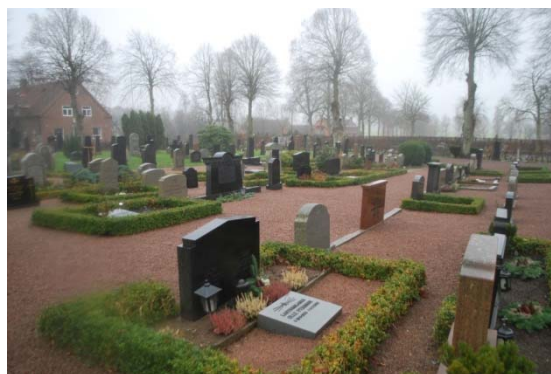
[9]: Östra utvidgningen