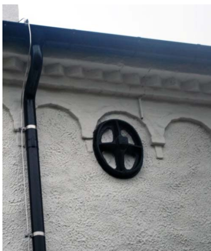
[1]: Listverk och ankarjärn på långhus

Kyrkans fönsteröppningar är rundbågiga, frånsett korets rosettfönster, med en- eller tvåsprångiga slätputsade omfattningar. Korets, långhusets och tornets fönster från 1906 är uppbyggda med inmurade, svarta, spröjsade ramar av gjutjärn djupt indragna i fasaderna. Glasen är av blyspröjsat råglas med dubbla ytterbårder av färgat glas. Den inre bården kring korfönstren är utförd som en zig- zagbård. Solbänkarna är av räfflat vitmålat gjutjärn. Innerfönster saknas. I tornets klockvåning finns två ljudöppningar i varje väderstreck, försedda med djupt indragna luckor av brunmålad fjällpanel. På resp. gavelröste finns två rundbågiga nischer med två smala fönsteröppningar vardera, därovan ett rundblände. Mellan ljudöppningarna och nischerna löper ett dekorativt band av kvadratiska bom- och ljudhål, som är genomgående mot klockvåningen.