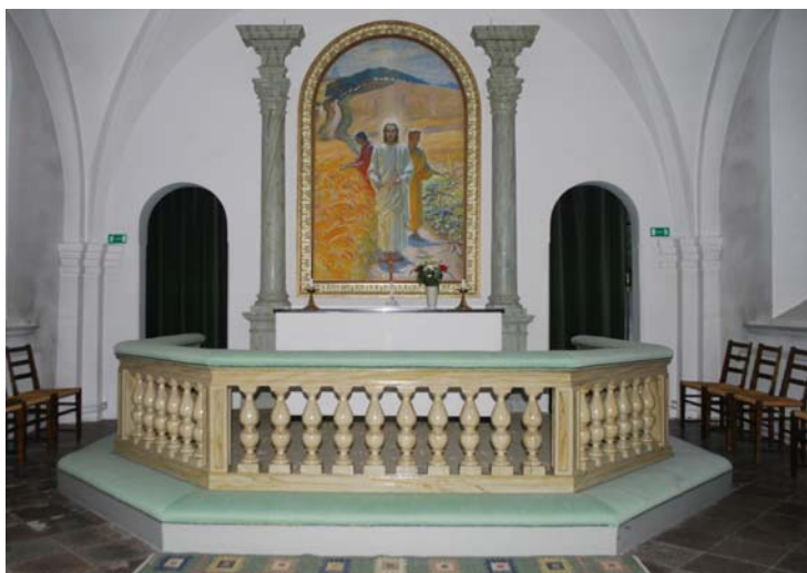
[4]: Altartavla (1948) och altarring