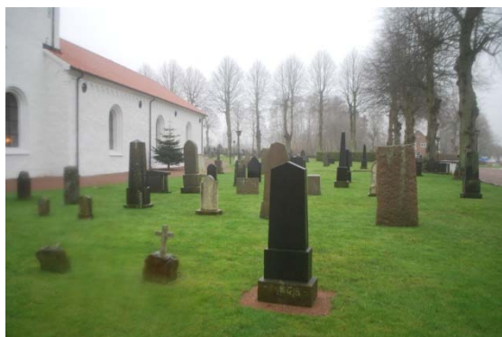
[8]: Gamla kyrkogården

med fyra delar, som alla har sin egen utformning. Mot landsvägen finns, omgärdat av en häck, ett grusat område med buxbomsomgärdade gravar, symmetriskt uppbyggt kring en murad fontän. Bakom kapellet finns urngravar. I mitten av kyrkogården finns en askgravplats från 2010 med två segmentformade växtäckta ytor att ställa minnesplattor i, och ett delvis utlagt, grästäckt kvarter med gravarna ställda mot rygghäckar. Ytorna längst i söder är grästäckta, med ett lapidarium av stenar som lagts på slänten.