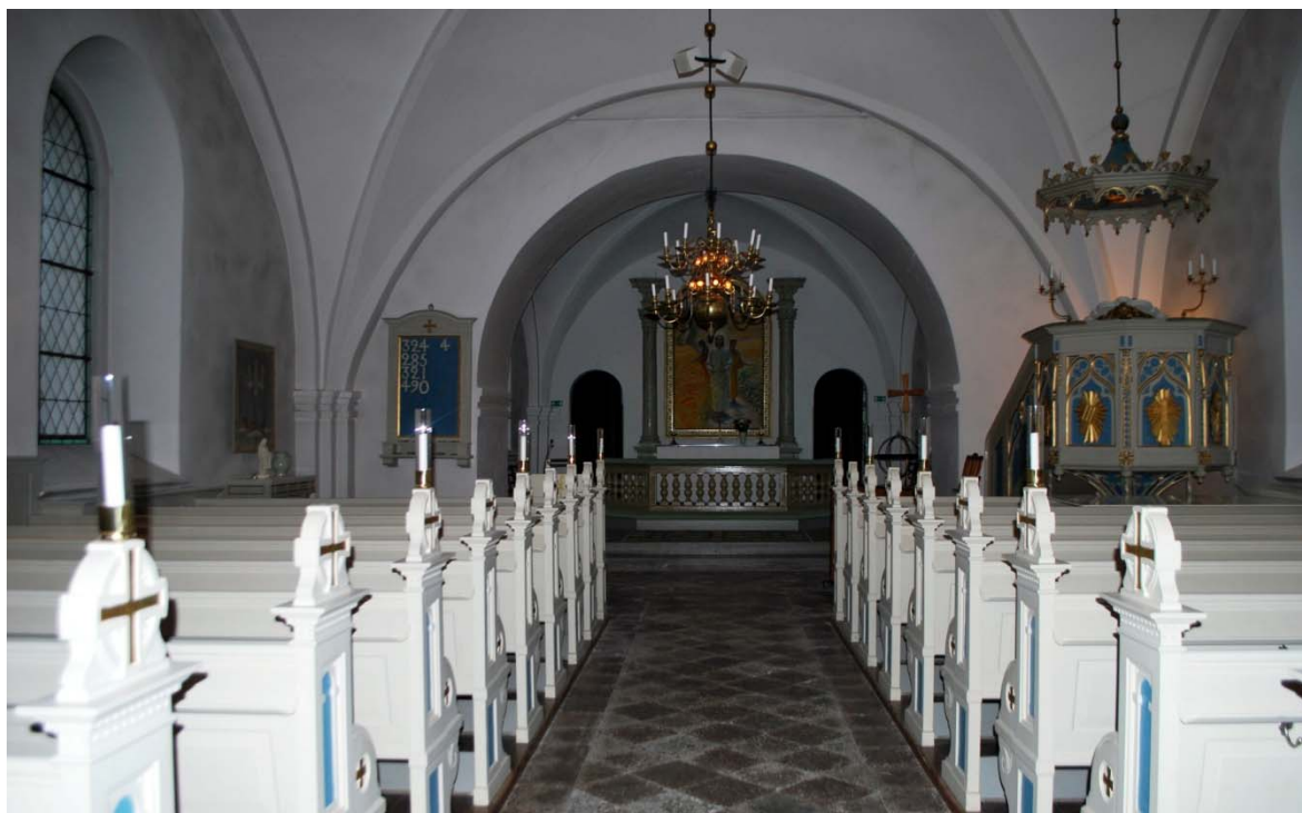
[3]: Långhuset mot koret

Långhuset [3] är enskeppigt, relativt brett och indelat i tre travéer med kryssvalv. Valven, som vilar på trespråkiga pilastrar med kragband, har firsidiga, släta ribbor och bågar. Gördelbågarna är genombrutna av dragjärn, och i slutstenarna hänger varsin malmkrona, den äldsta från 1662. Valv och väggar är putsade och avfärgade i vitt. Längs ytterväggarna löper en gråmålad bröstningspanel med höga speglar, uppåt avslutad av en tandsnittsgesims. Bakväggen mot vapenhuset är klädd med pärlspont.