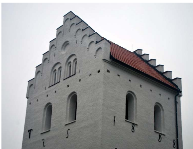
[2]: Tornet med trappgavlar

Kyrkans tak är alla sadeltak, sedan 1945 belagda med rött enkupigt tegel från Minnesberg. Plåtarbeten och avvattningssystem är utförda av svartlackad plåt. Långhustaket