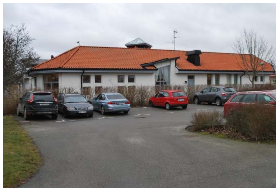
Fasad mot söder.