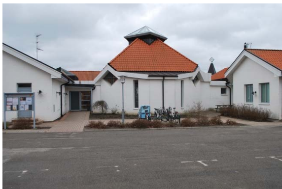
Fasad mot öster.

Dubbeldörrarna är täta aluminiumpartier med glasade sidofönster med horisontell indelning. Dörren har mörkgrå fyllning i ljusgrå ram med långa rostfria draghandtag. Mot öster finns ytterligare en entré med en tät enkeldörr med ett stort glasparti vid sidan. I lunchrum och församlingsal finns glasade utgångsdörrar. Teknik och förråd har täta aluminiumdörrar. Samtliga aluminiumpartier är grå. Framför huvudentrén står klockstapeln.