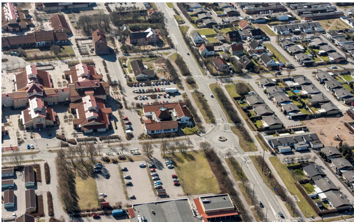
Flygfoto från norr.

Området har varit bebott sen förhistorisk tid visar fornlämningar. Fram till 1700-talet bodde socknens befolkning i byarna Bunkeflo, Vintrie och Naffentorp cirka fyra kilometer inåt land. Strandmarken var utmarker till byarna på slätten. Marken gick inte att odla på, den översvämmades ofta, men kunde användas till bete på sommaren. När kalk- och cementindustrier kring sekelskiftet 1800/1900 startade i grannkommunerna började strandmarkerna befolkas av arbetare och fiskare. På 1960-talet köptes strandängarna av ett byggbolag som tätbebyggde området med radhus och det var då som den stora expansionen av Bunkeflostrand började.