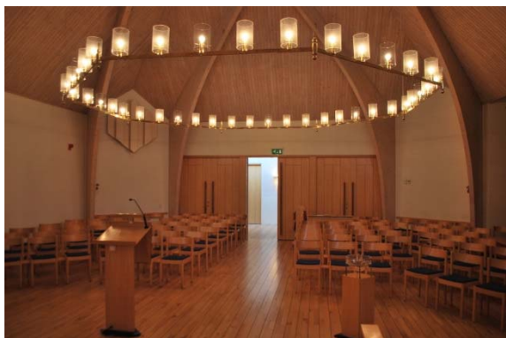
Kyrkorummet mot entrén i väster.

Dagsljus kommer från två högt sittande vita aluminiumfönster i rombform med indelning som ett kors och takljus från en pyramidformad glaslanternin i taktoppen. Orgeln är placerad i en nisch i norr. Längst bak vid entrén finns mixerbord. I söder finns en enkeldörr som leder till södra längan där sakristian finns som har trägolv, gipstak och målade väggar. Längs en vägg finns klädskap med trädörrar. Ett enkelt vägghängt altare och krucifix hänger på östra väggen i sakristian.