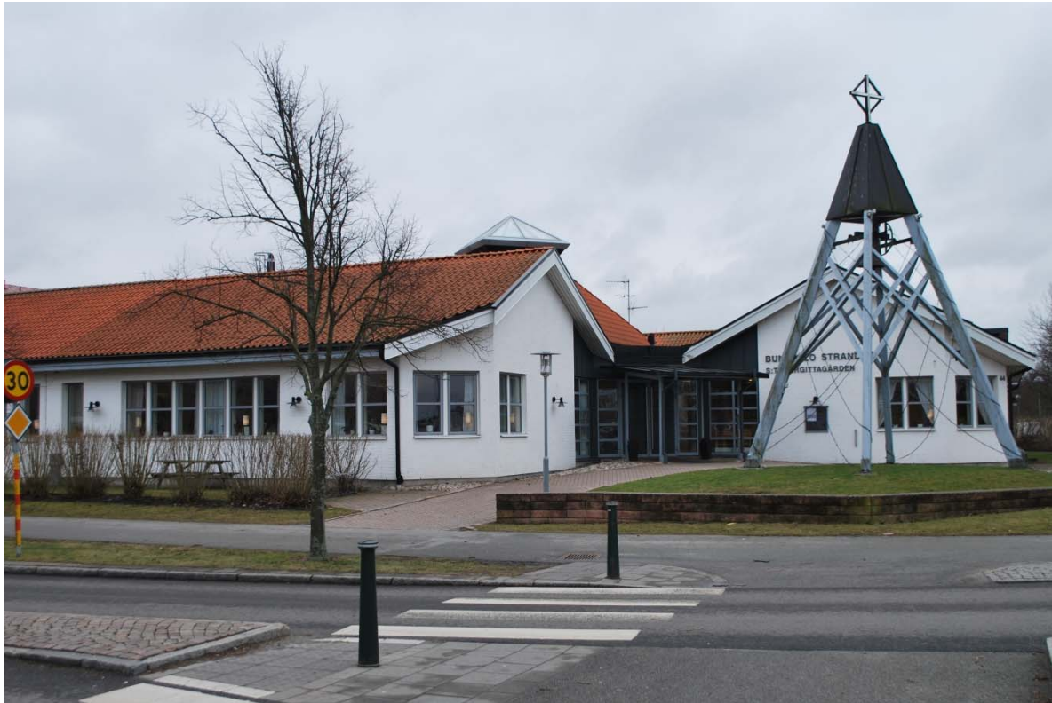
Entré mot nordväst.