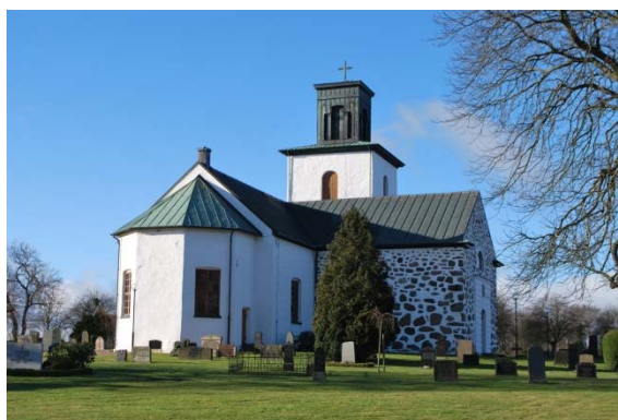
Fasad mot nordöst.