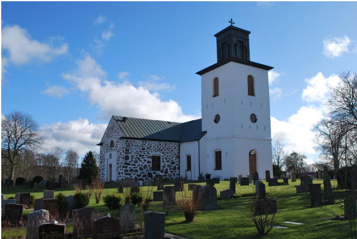
Fasad mot nordväst.