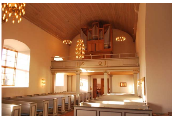
Långhuset mot orgelläktaren i väster.