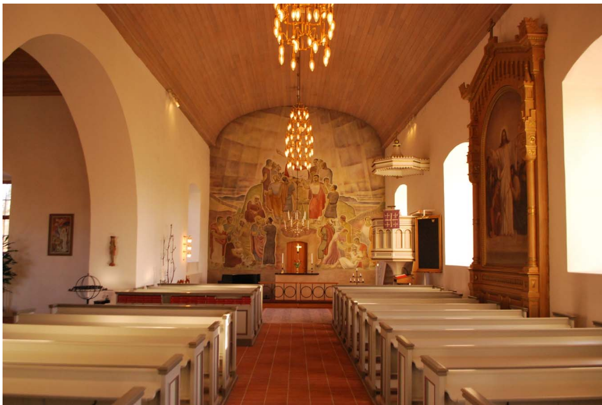
Långhuset mot koret i öster.