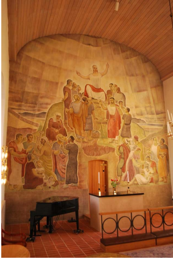
Målning av Pär Siegård i koret.