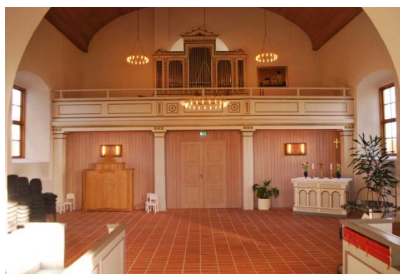
Nykyrkan i norr.