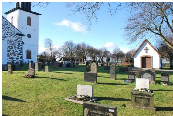
Kyrkogård och bårhus norr om kyrkan.

Delen längst i väster är en trädlund med ett 20-tal olika trädslag. Askgravlundan är stenblock i en cirkel med namnplattor av metall.