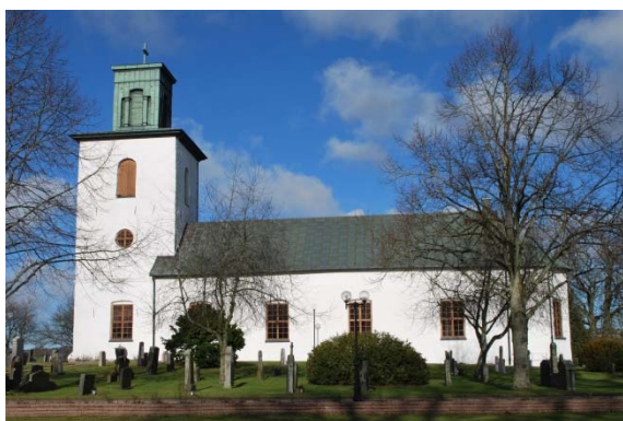
Fasad mot söder.

Långhuset och nykyrkan har sadeltak, sakristian ett femsidigt valmat tak. Tornet har flackt tälttak med en kvadratisk lanternin med ett flackt tak. Samtliga tak är klädda med valsad kopparplåt med förskjutna tvärfalsar. Takavvattningen är av koppar förutom nedre delen av stuprören som är bytt till svart plåt.