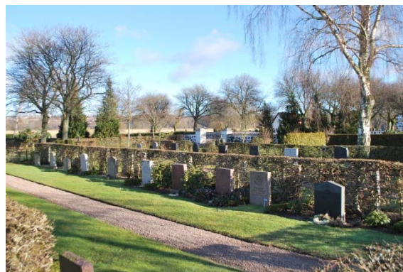
Nya kyrkogården med rygghäckar.