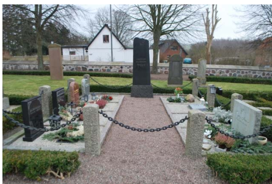
[7]: Förtätning av äldre gravplats

Öster om kvarter C ligger kapellet framför en grusad förplats. Norr om byggnaden binds gestaltningen ihop av en bred, trädkantad allé som mynnar i en smidesgrind mot gatan i öster. Gravplatserna i kvarter D [10] har endast liggande stenar, samlade framför låga häckar med några träd och vintergröna buskar fritt inplacerade. Till de mer namnkunniga som vilar i kvarteret hör Hugo Åberg, en byggmästare från Malmö som uppförde både Jägersro och Kronprinsen. Det yngsta och till stor del outlagda kvarter E har en liknande utformning. De enskilda vårdarna avskiljs inte av grusgångar, utan istället är marken till största delen gräsklädd. Kyrkogården avslutas i norr av en trädridå framför den stora förråds- och personalbyggnaden.