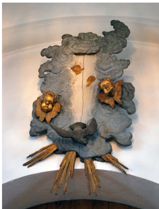
[6]: Delar av f.d. dopfuntskimmel

Altarring saknas. Den förutvarande altarringen från 1895 togs bort under 1990-talet.