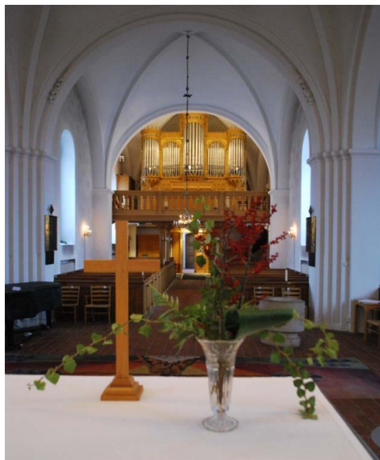
[3]: Kyrkorummet mot orgelläktaren

Från vapenhuset kommer man in i långhuset. Nivåskillnaden mellan de båda rummen tas upp av en kalkstenstrappa och en lös ramp byggd av träskivor. På trappan står ett bultat mässingsräcke. Längst ned i långhuset har man ersatt några bänkrader med en svängd, tät trappa till orgelläktaren [3]. Den vilar på avfasade pelare, vars trapetskapital bär konsoler till bjälklagets primärbärverk. Bjälkarna är synliga mellan vitmålade skivor. På ovansidan ligger stavparkett. Räcket mot långhuset är genombrutet av trepassbågar, och liksom läktarens övriga synliga träpartier ekådrat med förgyllda detaljer.