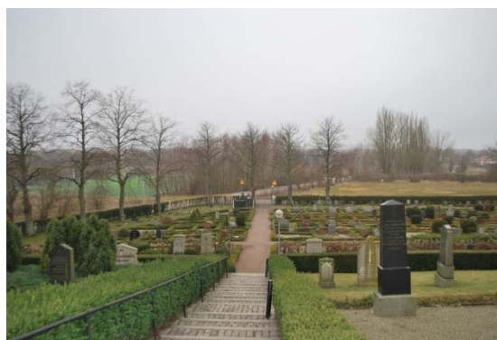
[8]: Vy mot utvidgning i väster