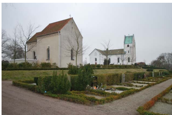
[9]: Kapellet från kvarter C