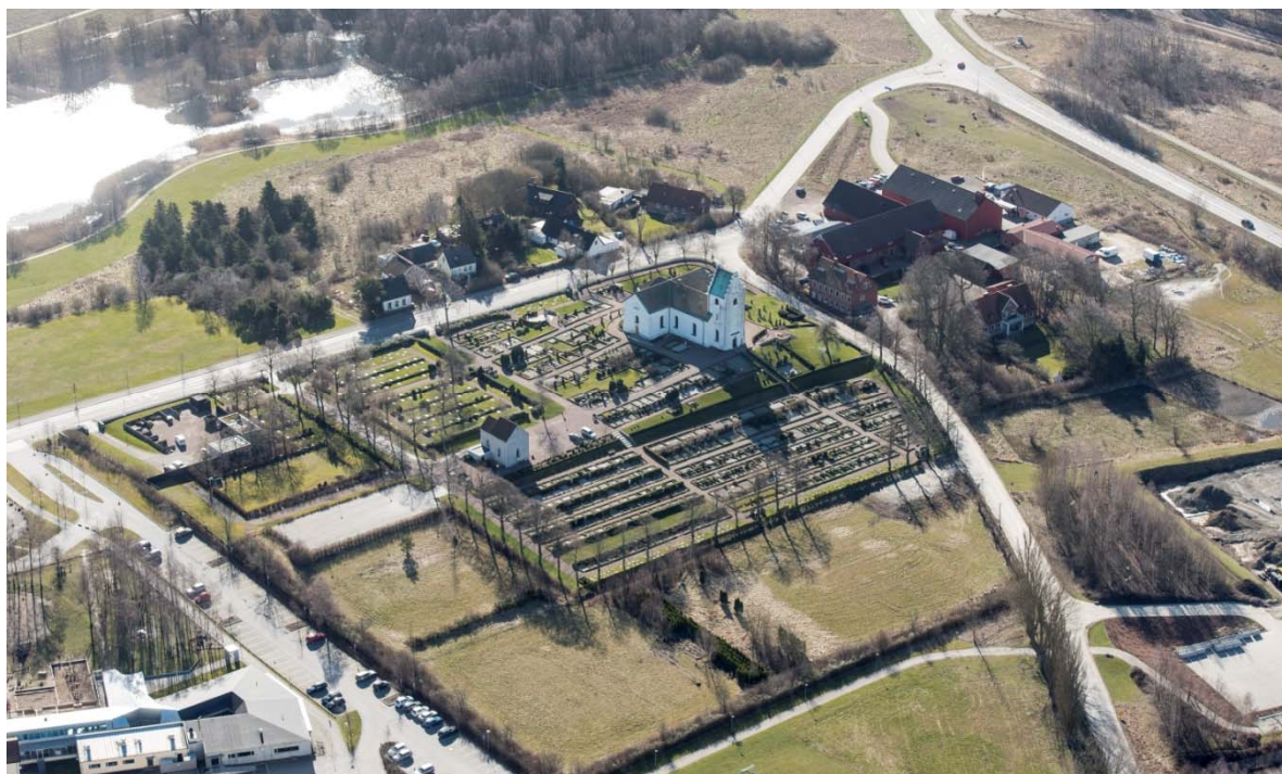
[1]: Husie by från nordväst

Husie ligger i östra delen av Malmö kommun. Bynamnet kan sannolikt tolkas som ordet ”Husö”, den med hus bebyggda ön. På ön – tolkad som ”höjden i landskapet” - byggdes under medeltiden en sockenkyrka, som under lång tid band samman befolkningarna i byarna Husie, Kvarnby och Östra Skrävlinge. Den lilla byn [1], som med tiden växte ut till några gårdar, ser i stort sett likadan ut idag som på enskifteskartan i början av 1800-talet. Byn domineras stort av kyrkan, och de få husen är samlade öster och söder om kyrkan. Den mest framträdande gården, Husie boställe, har idag byggts ut med flera ekonomibyggnader åt olika småindustrier.