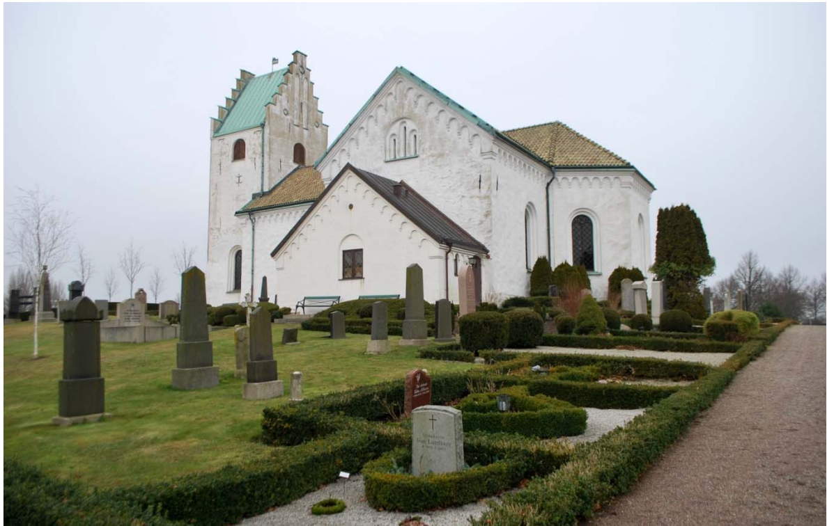
[1]: Kyrkan från sydöst med den tillbyggda sakristian