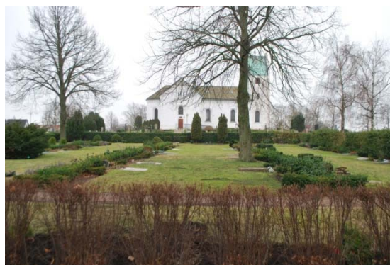
[10]: Kvarter D