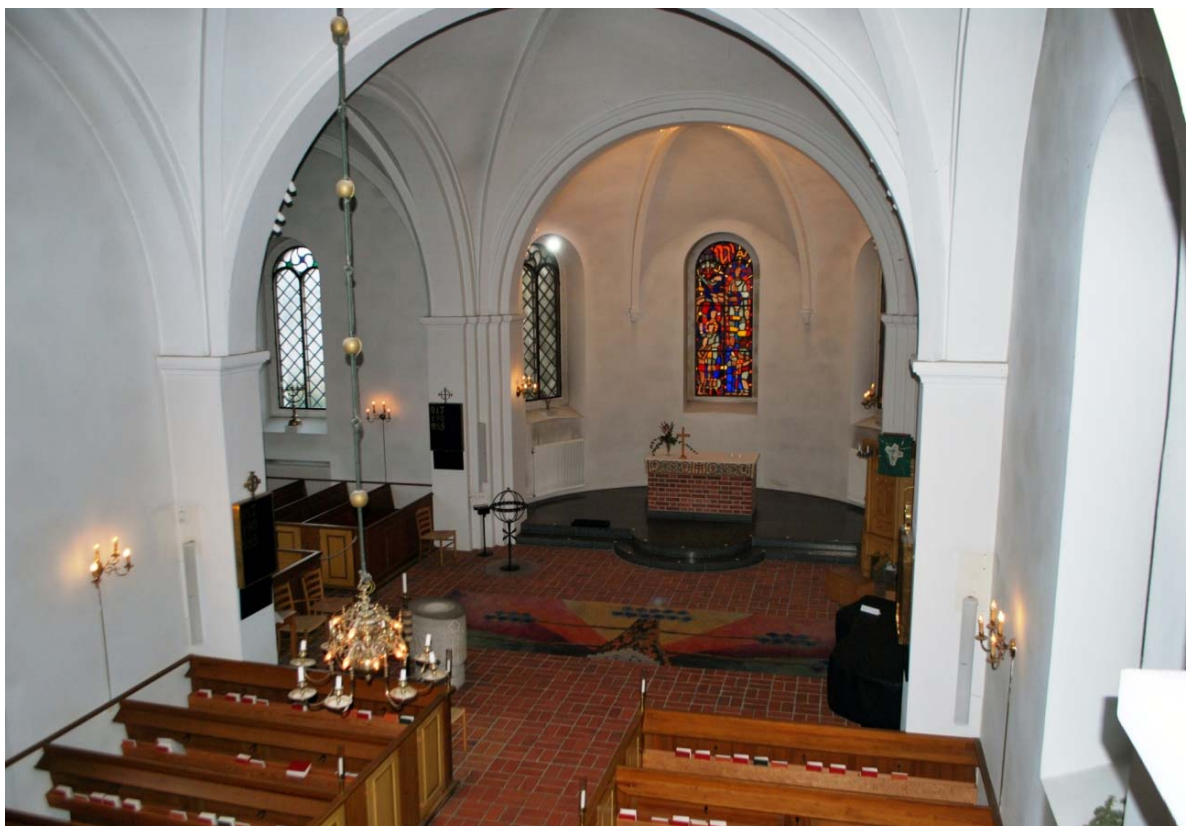
[4]: Kor och långhus

Från södra korsarmen nås sakristian via den ursprungliga sydportalen. Den har formen av en långsmal rundbågig nisch, i vilken sitter en kölbågig, mattlackad enkeldörr från 1973. Ovanfönstret i nischen är igensatt. I volymen med sakristian finns även toalett och förvaringsutrymmen. Materialen är enkla och funktionella.