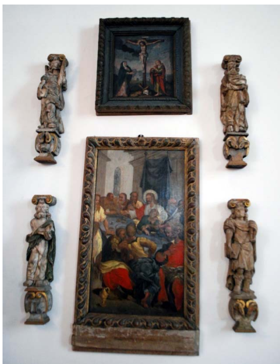
[5]: Delar av f.d. altaruppsats