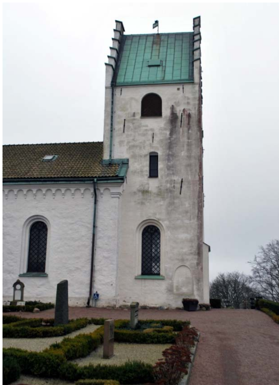
[2]: Tornets norrfasad med medeltida öppning

Publika entréer finns i tornets västfasad och i norra korsarmen. Portalen i södra korsarmen har gjorts om till koppling mellan långhuset och sakristian. Den framskjutna västportalen är utformad som en perspektivportal med två rundbågiga språng, som omger en kölbågig pardörr. Dörren av okänd ålder är klädd med snedställd träpanel. Till vänster om dörren, på norra tornfasaden, syns en idag blinderad medeltida öppning [2]. Den norra sidodörren är tillsammans med ett rundbågigt fönster inskriven i en långsmal, rundbågigt täckt nisch. Den kölbågiga dörren kommer från 2000 och är klädd med stående träpanel. Dörren nås via en granitbeklädd ramp med svarta smidesräcken vid sidorna.