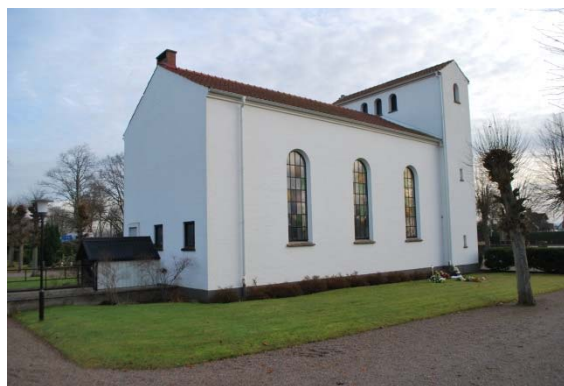
Fasad mot nordväst.