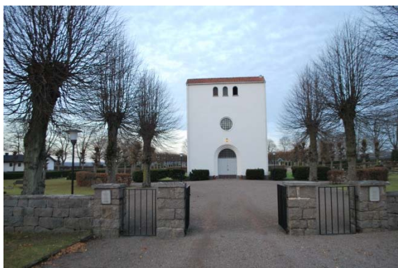
Fasad mot söder.

Sadeltaken på långhus och torn är belagda med röda enkupiga tegelpannor. Tornets takfall har omvänd riktning mot långhusets. Pannorna ligger i bruk ända ut på gavlarna utan täckplåtar. Takavvatningen är av vit plåt.