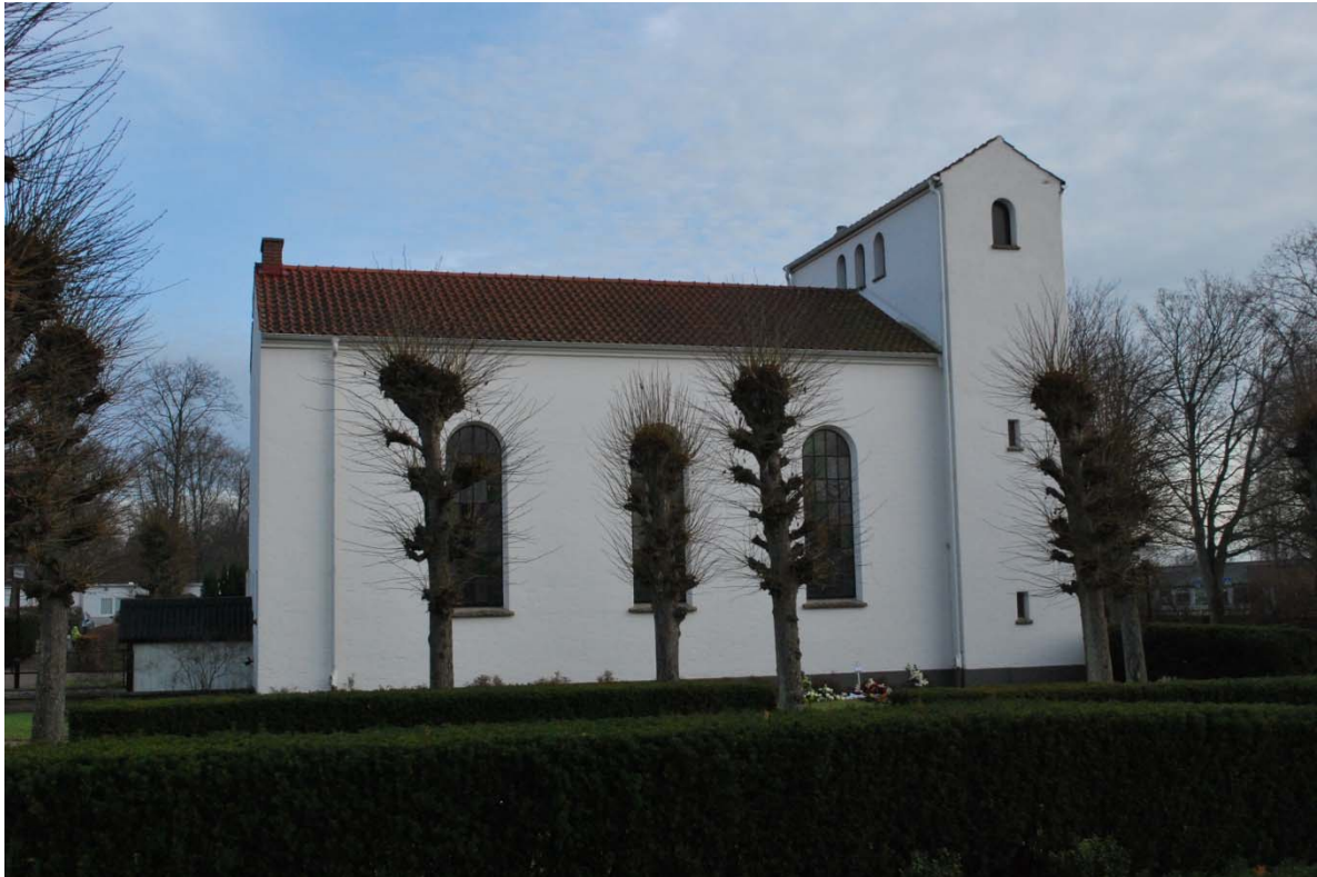
Fasad mot väster.