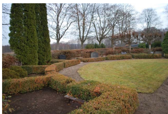
Mittaxelns avslutning i norr.