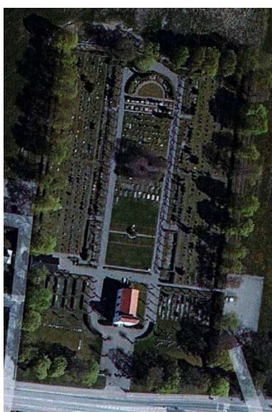
Flygfoto över anläggningen från hitta.se.

riktning som är kantade med kraftigt hamlade lindar, gångarna delar kyrkogården i tre områden. Lindarna är klippta som arkader. Yttersidorna är grässådda och gravstenarna står direkt i gräs. Dessa hade tidigare buxbomsinramning och indelning av kvarteren med avenbokshäckar. I mittgården finns minneslund och meditationsplats. Minneslundan har i mitten ett hängande sorgeträd omgivet av en cirkelrund plantering och ljusbärare. På meditationsplatsen finns en damm med springvatten omgiven av höga lindar. Längst i norr i mittaxeln finns ett litet område kvar med halvcirkelform med gravar inramade med buxbom. I söder runt kapellet finns urnlundarna med olika utformning från olika tider. En av urnlundarna har gravplatser inramade med betongsten, i en senare urnlund är stenarna placerade i bågformer i gräsmattan. Ett speciellt kvarter finns för barngravar.