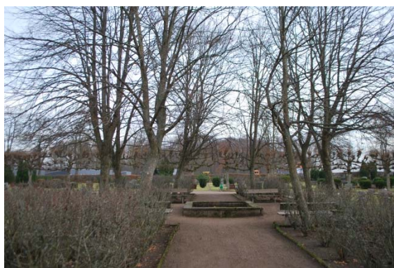
Meditationsplatsen i mittaxeln.