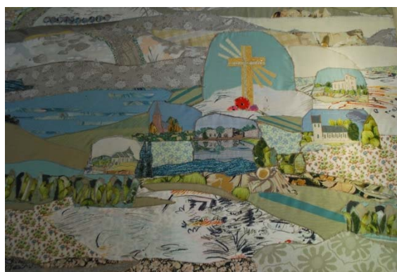
Detalj av altarbild, textil applikation med bygdens kyrkor.

Orgelläktaren och klockvåning nås med en trätrappa från vindfånget. Orgelläktaren har brunmålat brädgolv, putsade målade väggar och tak och dagsljus från ett stort runt fönster. I klockvåningen är det öppet upp i nock med synlig takstol, brunbetsad liksom i långhuset, brädgolv och putsade, målade väggar. Klockstolen är av järn. Åtta ljudöppningar med brädluckor finns i klockvåningen.