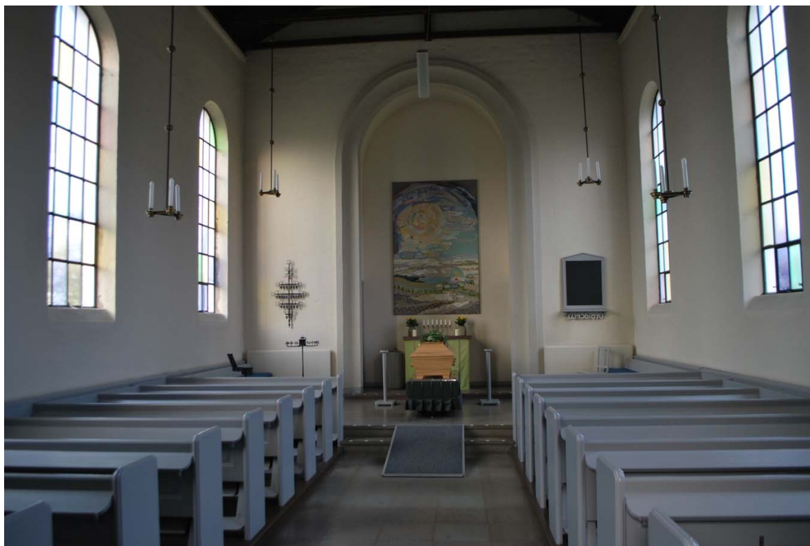
Långhuset mot koret i norr.

ligger i tamburen och heltäckningsmatta på golvet i sakristian. Orgelläktaren i tornet har en rundbågig öppning mot långhuset. Den täta läktarbarriären av stående brädor och halvrunda ribbor är målad i ljus och mörkt grått. Barriären är senare förhöjd med ett fururäcke.