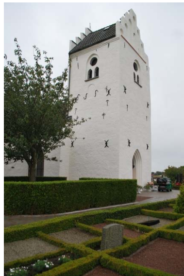
Tornet från nordväst.