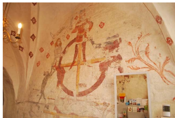
Målning, "Livets hjul" i vapenhuset.