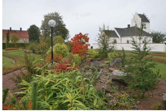
Askgravlunden längs slingrande vattenränna.