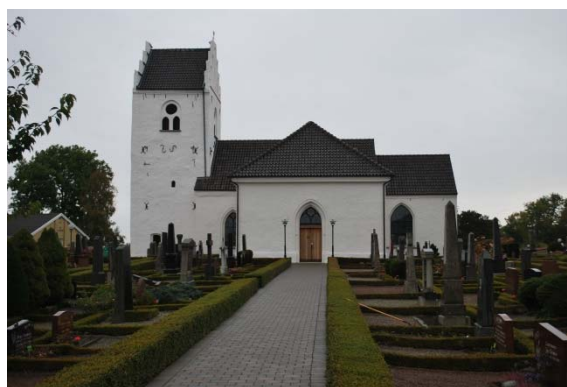
Fasad mot söder.

Fönstren sitter i spetsbågiga nischer omgivna av ett slätputsat, profilerat listverk. Gjutjärnfönstren med kvadratisk indelning och överst ett fyrpass är indelat med blyspröjs.