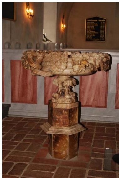
Dopfunten av alabaster.