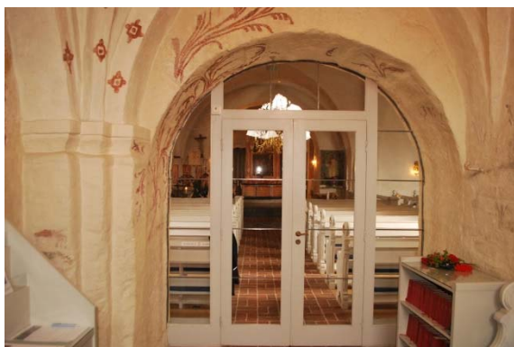
Vapenhuset i tornet mot entré till långhuset.

Sakristian är avskild med ett skrank av trä med draperimålning. Två dolda dörrar i skranket leder till sakristian där golvet är täckt med parkettgolv.