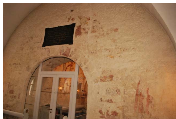
Målningsfragment på västväggen i långhuset.