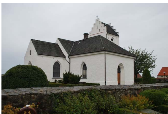
Fasad mot nordöst.

Tornet har ljudöppningar i alla väderstreck, utformade som en nisch med två spetsbågiga öppningar samt en rund öppning ovanför. Tornets gavelrösten är försedd med vertikala slätputsade nischer. Tornets trappstegsgavlar har tinnar täckta med tegel. Tornmurarna har över trettio svarta ankarjärn på fasaden.