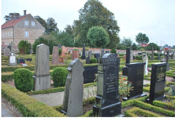
Kyrkogården söder om kyrkan och f.d. prästgården.