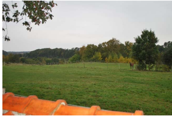
Utsikt från kyrkogården mot Rååns dalgång