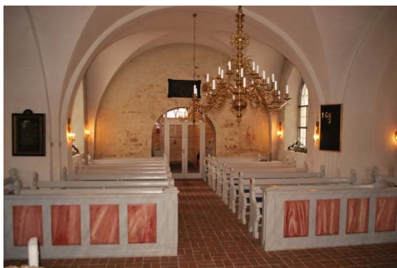
Långhuset mot väster.