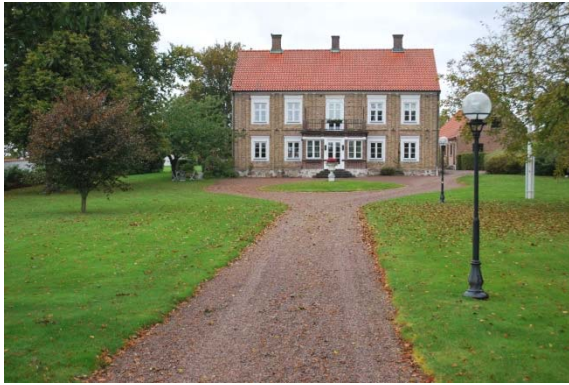
F.d. prästgården öster om kyrkan.