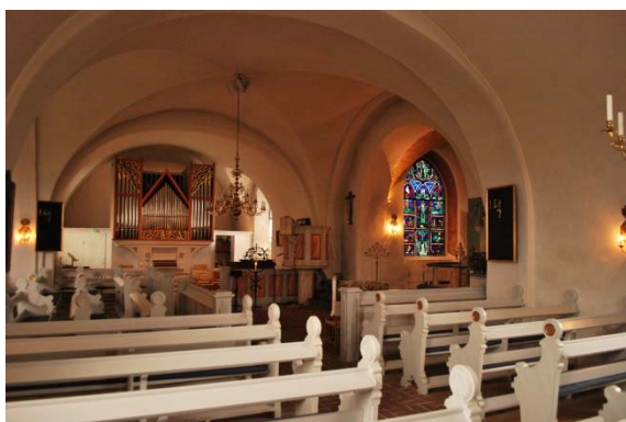
Mot norra korsarmen med orgel.