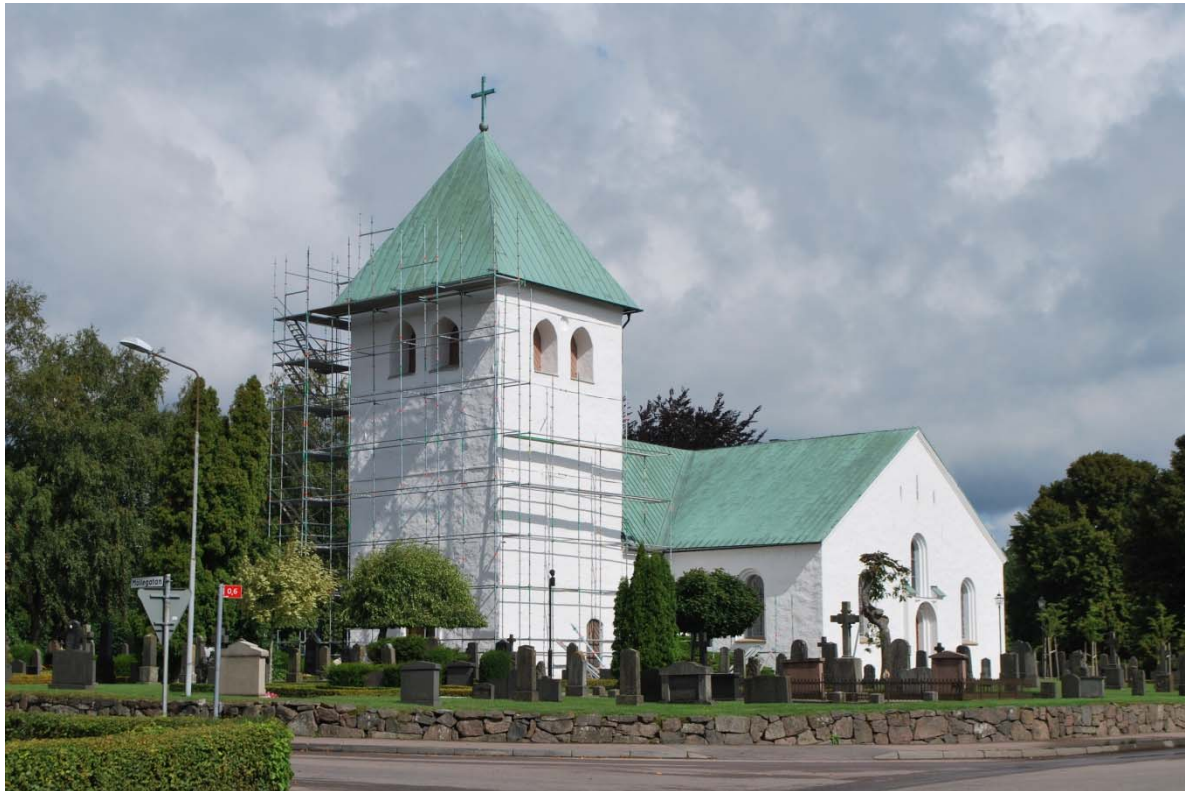
Fasad mot sydväst.