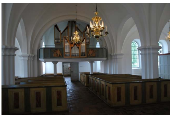
Mot orgelläktaren i väster.