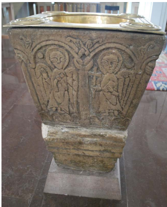
Dopfunt från romansk tid.

Predikstolen med baldakin av bemålat trä är från ombyggnaden 1868. Trappa och postamentet är från 1931. Korgens sidor har vardera två rundbågsformade fyllningar. I över och underkant finns profilerat listverk och fyllningar med text. Korgen står på ett åttasidigt postament. Postamentets och korgens fyllningar är marmorerade i rödbrunt. Baldakinen är åttkantig och följer predikstolens planform. Baldakinen kröns av en förgylld glob och under hänger en duva.