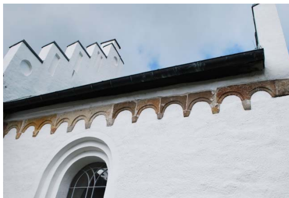
Rundbågsfris av sandsten på koret.