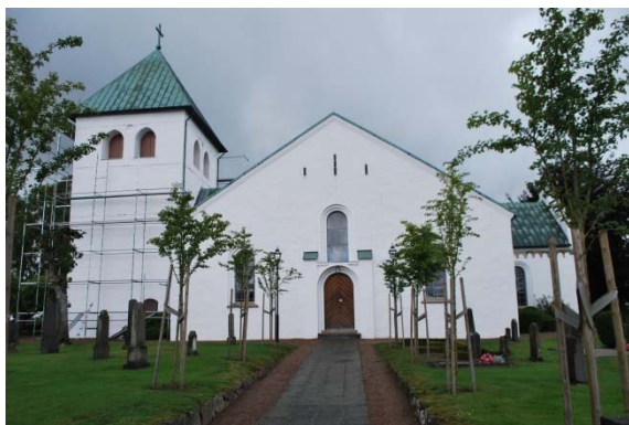
Fasad mot söder.