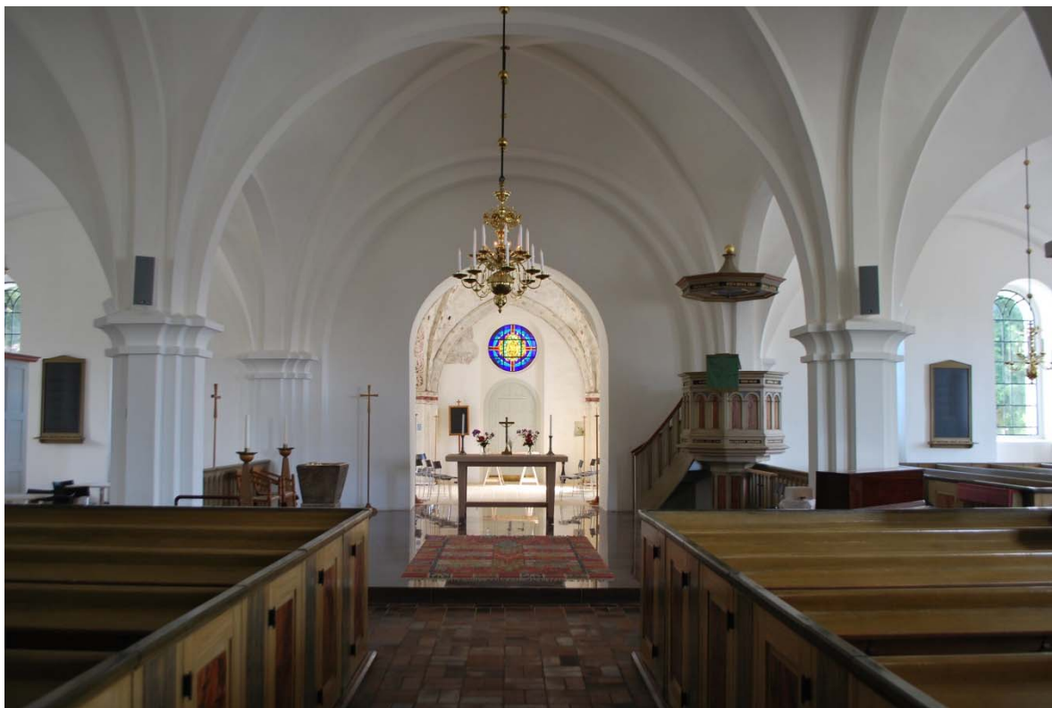
Mot koret i öster.