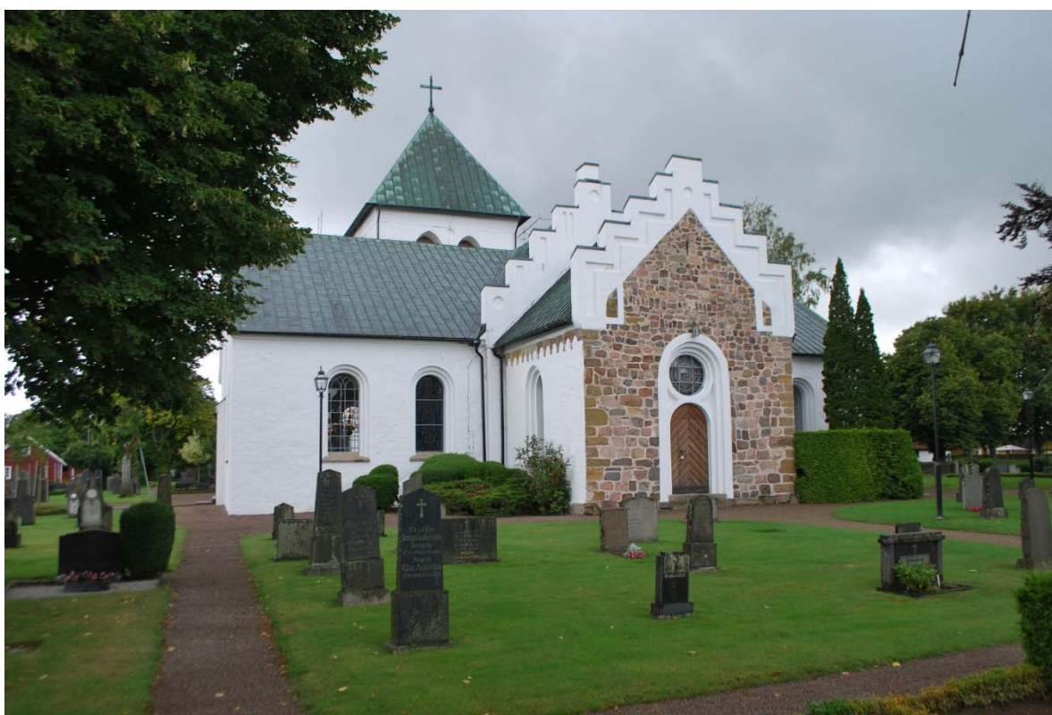
Fasad mot sydöst.

Kyrkan har fyra ingångar, huvudingång i väster genom tornet, en ingång i vardera korsarmaren i norr och söder och en ingång i koret i öster. Ingång till tornets övre våningar är genom en dörr på tornets södersida. Samtliga ytterdörrar är från 1930-talets restaurering och är klädda med panel i fiskbensmönster. Dörrarna är utvändigt försedda med smidda dekorativa spikhuvuden. Invändigt är dörrarna gråmålade ramverksdörrar med kvadratiska fyllningar. Samtliga muröppningar är rundbågiga. Ovanför koringången sitter ett runt fönster med glasmålning. Korsarmarnas dörrar omges av slätputsade kontreforter som i ovankant är kopparklädda.