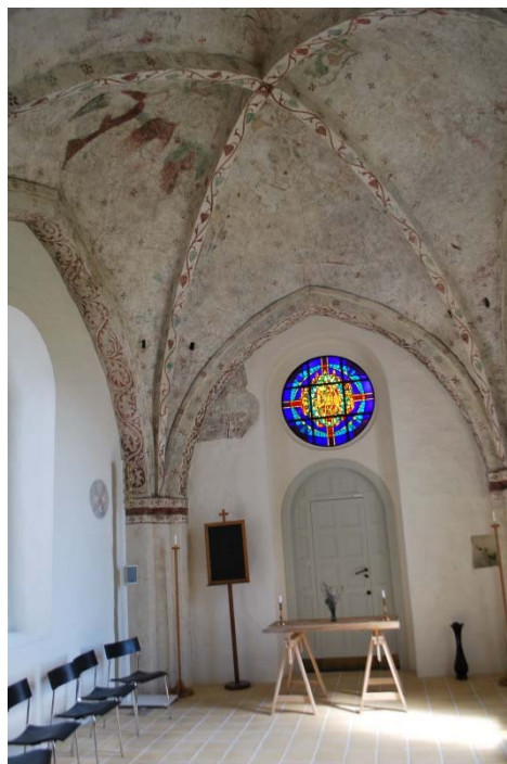
Kalkmålningar i kapellet.

Bänkinredningen tillkom 1931 efter ritningar av Nils Blanck men tillverkades i stil efter den äldre bänkinredningen från 1868. Bänkarna är slutna. Ryggar, dörrar och skärmar är i ramverk med fyllningar. En profilerad överliggare binder ihop delarna. Bänkarna är ådringsmålade med marmoreringsmålning i dörrfyllningarna och på gavlarna. Stolar , stapelbara ”Campus” från Lamnhult. Kromben med sits och ryggbricka i svart björk. Stolarna är placerade i norra korsarmen vid cafébord och i det medeltida koret.