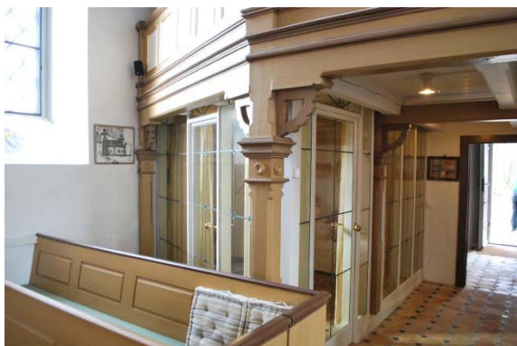
Inbyggnad för sakristia under orgelläktaren.

täckt med en röd gångmatta. Predikstolen står i långhusets sydöstra hörn. På norrväggen hänger delar av en äldre altartavla av Johan Ullberg.