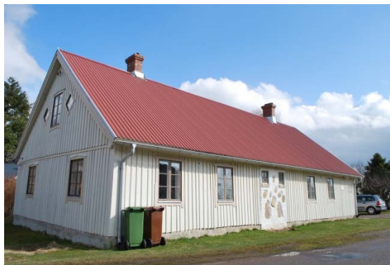
Ed fattighuset som också innehållit bank o kommunrum.

Össjö socken har under 400 år helt dominerats av Össjö gård som ägt stora delar av socknen. Gården anlades på 1500-talet under Skillinge gård men friköptes på 1600-talet. Under befolkningsökningen på 1700-1800-talen flyttade många torpare till trakten som gjorde dagsverken på Össjö gård. Åkerarealen utökades när utmarker omvandlades till åker. Den nuvarande huvudbyggnaden på Össjö gård är från 1815 i sengustaviansk stil och är statligt byggnadsminne med gråstensflyglarna från slutet av 1700-talet. Till gården har hört sågverk, tegelbruk, kvarnar och arbetarbostäder. Idag bedrivs främst skogsbruk på gården.