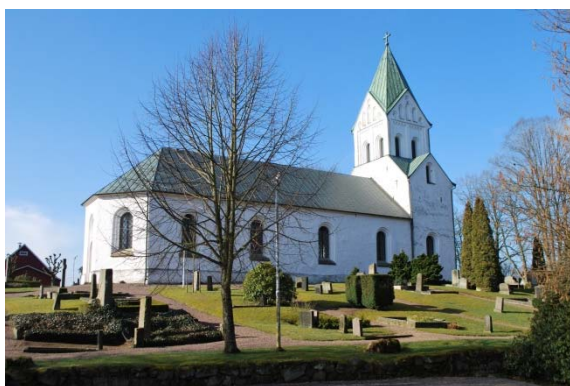
Fasad mot nordöst.

Kyrkobyggnaden består av ett långhus med en tresidig avslutning i öster och ett torn i väster. Långhusets västra del och nedre delen av tornet innehåller medeltida murverk, övrigt murverk är från ombyggnaden 1864-1866.