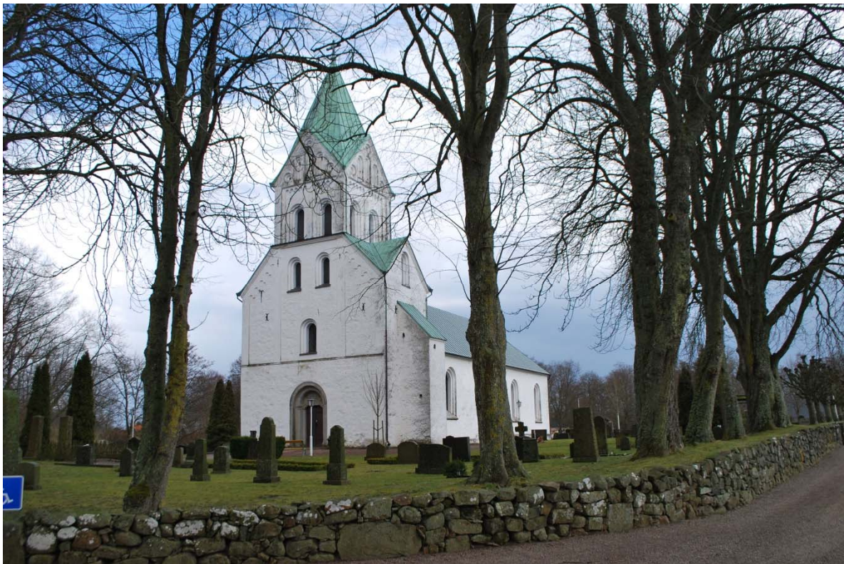
Fasad mot sydväst.