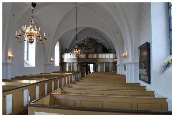
Långhuset mot orgelläktaren.

Koret ligger ett steg högre än långhuset och golvet är belagt med nytillverkade gula och svarta tegelplattor lika golven i vapenhuset och rummen under orgelläktaren. Korvalvet är sexkappigt och målat koboltblå. Dopfont och ambo står på norrsidan, ljusbärare på södersidan. Lösa stolar och flyttbara knäfall är uppställda längs korväggarna. Altarskranket avdelar koret med textilförvaring bakom skranket. I mitten av skranket står Thorvaldsens Kristusfigur på ett marmorerat fundament. Framför fundamentet står ett fristående altare. Altarordningen är förutom Kristusfiguren från 2005. I koret hänger en ljuskrona från 2005 bestående av en svävande mässingsring och två klot ovanför och nedanför i cirkelns mittlinje.