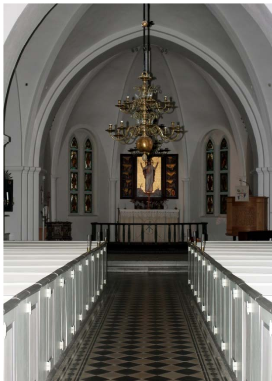
[3]: Kyrkorummet mot koret

Från vapenhuset leder en pendeldörr i den murade skiljeväggen till långhuset. Dörren är utformad på samma sätt som ytterdörren. Långhuset är täckt av kryssvalv med fyr-sidiga ribbor och spetsiga sköld- och gördelbågar, som förenas i trespråkiga pilastrar. Längst ned vid pilastern i övergången mellan långhuset och norra korsarmen märks en