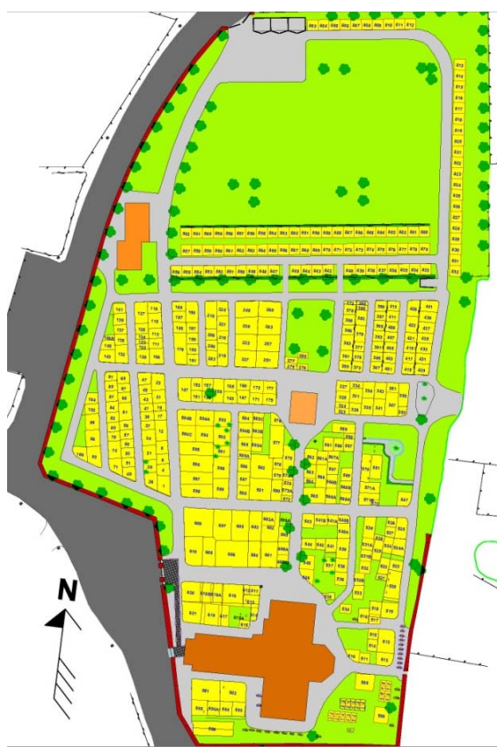
[6]: Karta över kyrkogården

grindar innanför kraftiga, putsade pelare med kontak av koppar. Från ingångarna i väster leder ett stråk av smågatsten upp mot kyrkan, i övrigt är alla gångar grustäckta. Kvarteren är omväxlande grussatta och grästäckta med många vakanser, i synnerhet mot nordost. Gravplatserna är omgärdade av buxbomshäckar, i enstaka fall av stenkantar. Gravplatserna närmst långhuset är till största delen från 1800-talets andra hälft, typiska för denna tid med många höga, flerdelade vårdar i mörk granit. Även de mer varierade vårdarna i marmor med biskviporslin och påsatta dekorer var vanliga då, och förekommer t.ex. i en formmässigt mer något ovanlig sten över syskonen Kjersti& Elna Olsson. Gravminnet består av två draperade kolonner, som förenas i en gemensam tvådelad bas av marmor och granit.