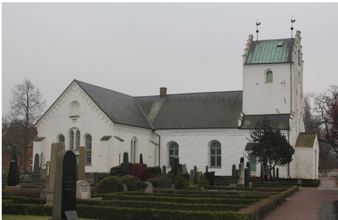
[1]: Kyrkan från nordväst

Kyrkobyggnaden [1] har formen av en korskyrka. I väster finns ett medeltida torn och långhus, i öster ett femsidigt avslutat kor och korsarmar i norr och söder. Koret och korsarmarna kommer från Brunius ombyggnad av kyrkan.