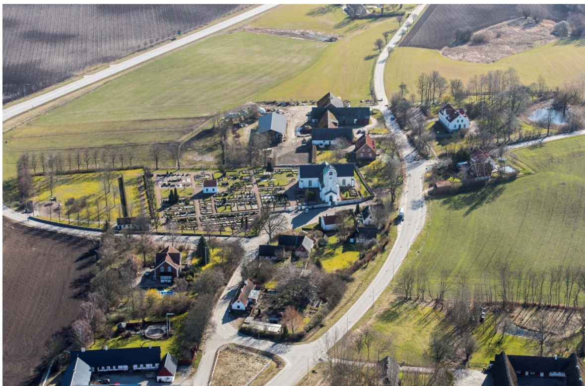
[1]: Södra Sallerup från väst

Södra Sallerup ligger i östra delen av Malmö kommun i ett mjukt kuperat landskap. Landskapet präglas av många små våtmarker, ofta omgivna av hamlade pilar. Byn ingår i en rik kulturbygd med förhistoriska anor, något som bl.a. påvisas av de flintgruvor från stenåldern man påträffat. Kring brytningen lär ha uppstått en omfattande bosättning, som vid vikingatiden utvecklats till en runt 15 hus stor by söder om dagens kyrka. Bynamnet Sallerup anses ha etablerats då, som en sammansättning av namnet Saxulf - kanske en storman i trakten - och efterleden -torp.