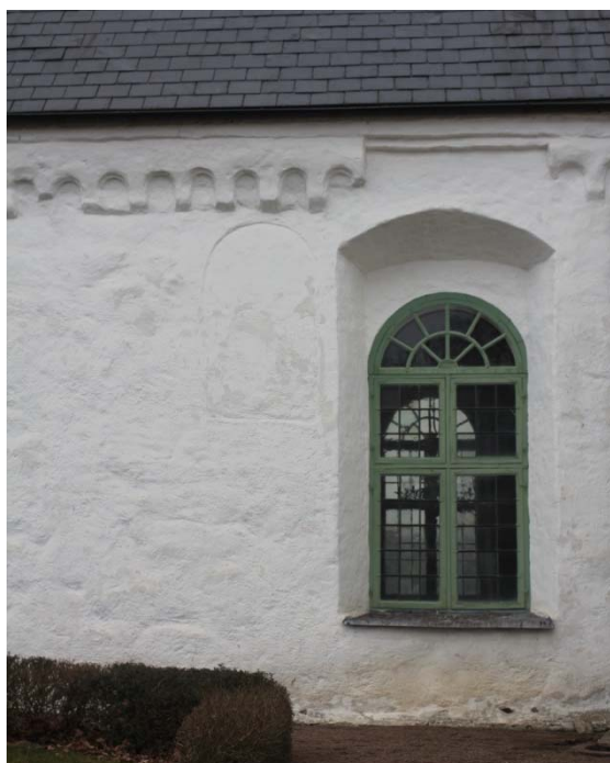
[2]: Fönsteröppningar från medeltid/1700/1800-tal, medeltida rundbågig takgesims

Koret och korsarmarna är byggda av vitputsat, gult tegel. Längs takfoten löper en enhetlig rundbågsfris, liknande den på långhuset, och överst en utkragande gesims i flera språng. Murarna stötts över hörnen av strävpelare avtäckta med betongplattor.