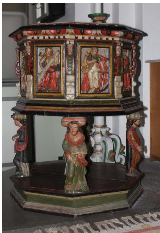
[5]: Dopfont i trä från 1600-talet

Bänkinredningen är i huvudsak bevarad från Brunius ombyggnad 1863-64, men byggdes om 1982 för att förbättra sittkomforten. Gavlarna är släta, dörrarna spegeldörrar med bevarade äldre gångjärn och dörrhaspar. Färgsättningen går i grå toner. I sitsarna av hela bräder ligger lösa, gröngrå dynor.