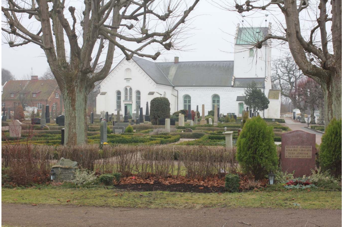
[7]: Kyrkogården mot söder från 1975 års utvidgning