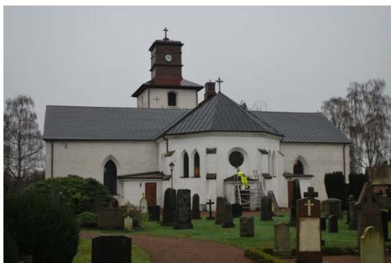
Fasad mot öster.

Torntrappans dörr av breda plank sitter i en mycket smal öppning.