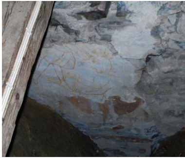
Kalkmålning på vind, daterad före 1175.