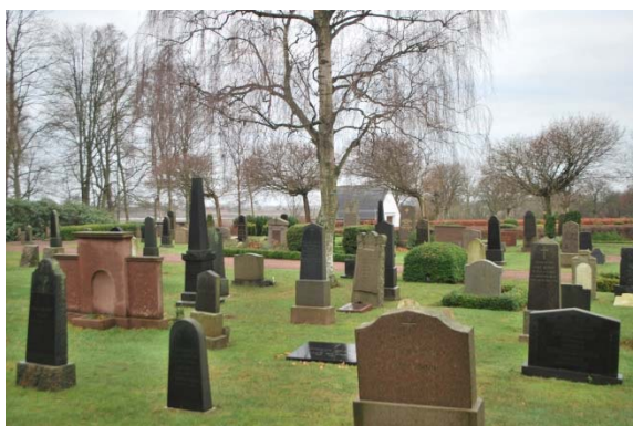
Gamla kyrkogården sydväst om kyrkan.

Ett gravkapell, från 1956, ritat av arkitekt Arne Lindström, står sydväst om kyrkan på nya kyrkogården. Fasaden är av vitmålat tegel och taket ska täckas med plåt. (Koppertaket är stulet). Ralf Bergholtz har gjort en glasmålning i kapellet. En byggnad för kyrkogårdsförvaltningens personal ligger intill vägen nordväst om kyrkan. Huset är uppfört omkring 1880. Fasaden är av brunt tegel och taket belagt med gult tegel. Gavelröstet är rikt artikulerat med mönstermurning med blinderingar och sågskift.