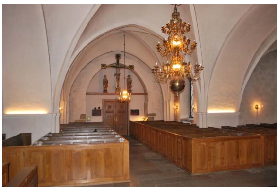
Långhuset mot väster.