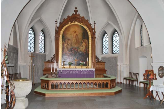
Koret med gravstenar, dopfont och altarupsats.