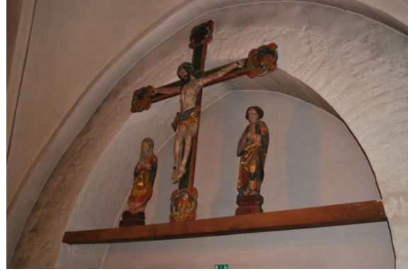
Kalvariegrupp från 1500-tal.

Storklockan är omgjuten 1742. Lillklockan är omgjuten 1747. Båda klockorna är omgjutna av Andreas Wetterholtz. Klockorna har inskriptioner och friser med bladmönster.