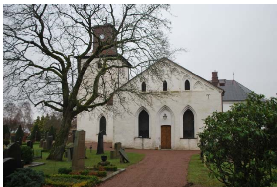
Fasad mot söder.