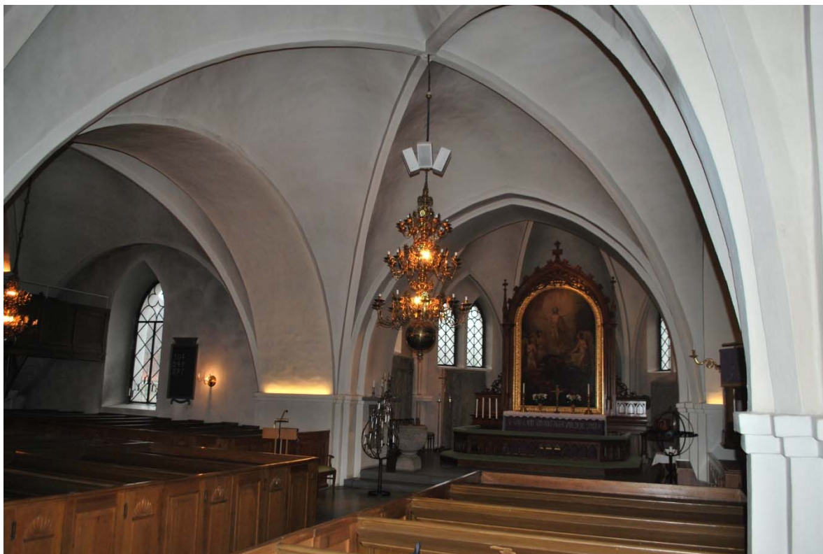
Långhuset mot koret och norra korsarmen.

orgelläktaren. Trappan är av terrazzo och orgelläktarens golv är täckt av heltäckningsmatta.