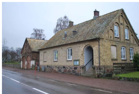
Fd prästgården, numera församlingsexpedition och förskola. Fd kommunhus intill kyrkogården.