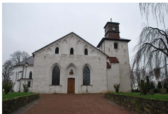
Fasad mot norr.

Taket är sadeltak och korstak över långhus och korsarmar, valmat tak över koret, tälttak över tornet och pulpettak över trapphuset. Taken på långhus, kor, korsarmar och torn är belagda med kopparplåt från 2009 i skivtäckning med dubbelfals. De horisontella falsarna är inbördes förskjutna. Taket på de låga, små utbyggnaderna för sakristia och fd bårhus är belagda med brun plåt. Takavvattningen är av koppar. Tornets lanternin har urtavlor åt alla väderstreck och taket kröns av ett kopparklätt kors.