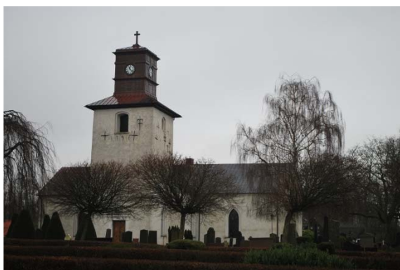
Fasad mot väster.