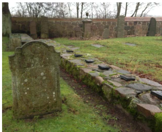
[7]: von Lindes i Axelvolds familjegravplats

I kyrkogårdens mitt står grundmurarna från den medeltida kyrkan kvar. Vid koret finns en ruinkulle med en minnessten över ätten von Lindes till Axelvolds gravvalv, som en gång legat under koret. Deras familjegravplats [7], omgiven av murar och kättingar, i sydvästra hörnet av tomten är i bruk. På kyrkogården finns ett varierat gravstensmaterial från 1800-1900-tal, bl.a. några skånska kalkstensvårdar i senempire.