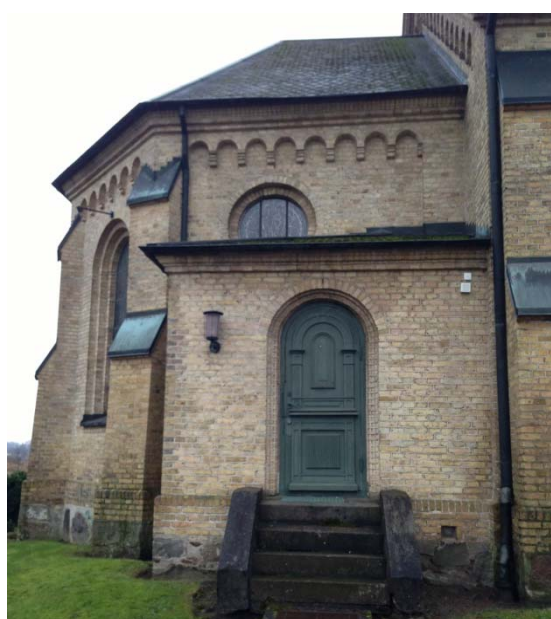
[2]: Ytterdörr till sakristia