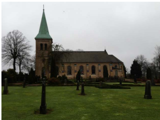
[8]: Ursprungliga nya kyrkogården, grästäckta ytor

Utvidgningarna mot söder [9] och väster avgränsas från den ursprungliga delen med grusgångar. Den södra utvidgningen är uppbyggd med singeltäckta gravar, kantade av buxbom, och med rygghäckar av samma växt. På flera gravplatser finns ett rikt bestånd av städsegröna växter. Delen avgränsas från omgivningen med metallstaket i öster, av samma typ som kring de ursprungliga delarna, och med en häck i söder.