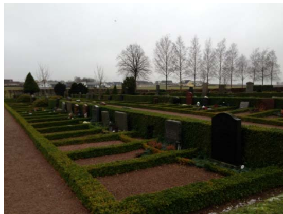
[9]: Södra utvidgningens buxbomskantade gravplatser

Den västra utvidgningen, som endast delvis är utlagd, omges på samtliga sidor av en avenbokshäck. I väster och söder står rader av björkträd längs häcken, och i norr ett antal lindar ut mot kyrkans parkering. Från denna löper en gång till begravningskapellet. Utvidgningens mittgång, som leder till kyrkans västportal, kantas av cypresser. Gravplatserna är genomgående grästäckta och avdelade med rygghäckar av avenbok. Gravstenarna är generellt sett låga, fabriksstillverkade granitvårdar, typiska för efterkrigstiden och framåt mot vår tid.