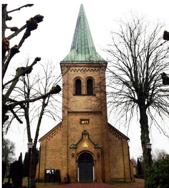
[1]: Tornets västportal

Torntaket är tältformat med en åttkantig spira, beklädd med kopparplåt i skivtäckning med halvförskjutna hakfalsar. Övriga taktytor, d v s långhusets sadeltak och korets- och sidoutbyggnadernas valmade sadeltak, är belagda med små eternitplattor, vars form efterliknar den tidigare spåntäckningen. Avvattningen är i koppar.