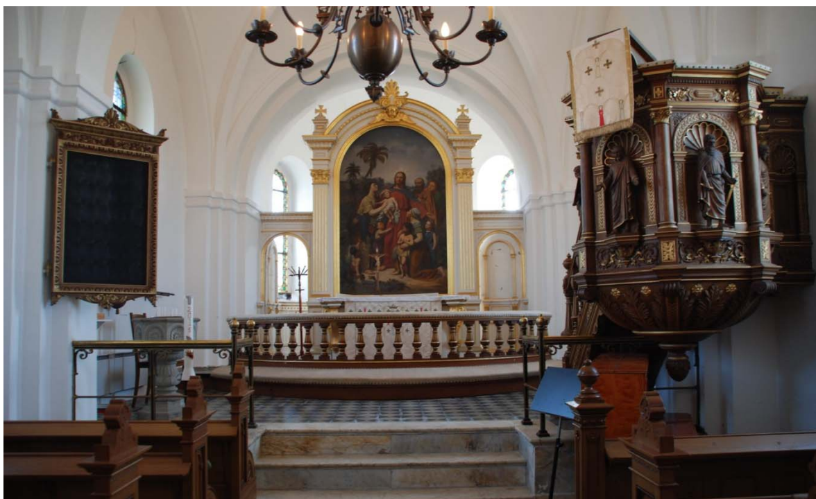
[5]: Koret med altaranordning, predikstol och dopfunt

Sakristian är inrymd i absiden, som täcks av ett hjälmvalv. Valv och väggar är putsade och kalkavfärgade, frånsett en bröstningspanel upp till fönstrens underkant. Denna inklädnad består av gråmålade pärlspontade brädor med detaljer i guld. Rummet är möblerat med stolar och ett ekådrat förvaringsskåp med integrerat skrivbord på altarskrankets baksida. I absidens östra sida bildas ett vindfång i yttermuren, genom att en ekådrad inre fyllningsdörr är placerad bakom ytterdörren i dörrsmygens insida.