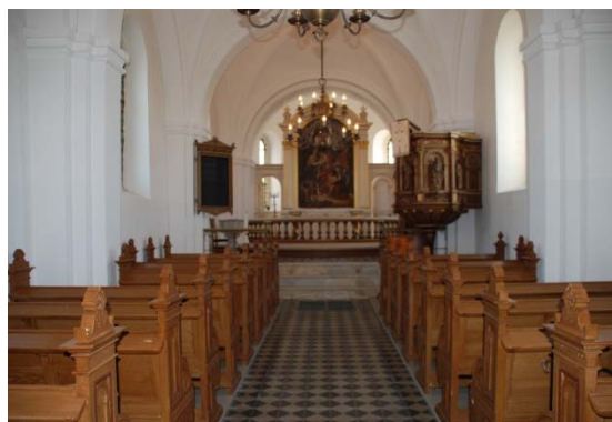
[4]: Långhuset mot koret