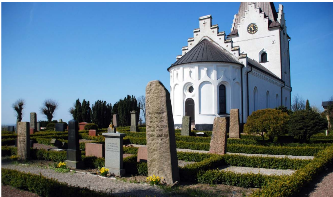
[6]: Kyrkogården från nordost med Nils Perssons grav i förgrunden

Hela kyrkogården [6] omges av en plattavtäckt, cementfogad gråstensmur, på vilken står ett svartmålat gjutjärnsstaket. Framför tornet finns ett grindparti med breda dubbelgrindar ut mot parkeringen och grusplanen i väster, där både sockenstugan och den gamla skolan är belägna. Runt hela kyrkogården löper en trädkrans av lindar. Kyrkogården är uppbyggd av sex stycken rektangulära, buxbomsinramade kvarter, samtliga likt kyrkan omgärdade av singelgångar. De enskilda gravplatserna är grustäckta och omgärdade av buxbom, även de många vakanta platser som finns framför allt i den utvidgade delen mot söder. Vissa vårdar har egen växtlighet av städsegröna växter och perenner. Förutom trädkransen saknas högre växtlighet.