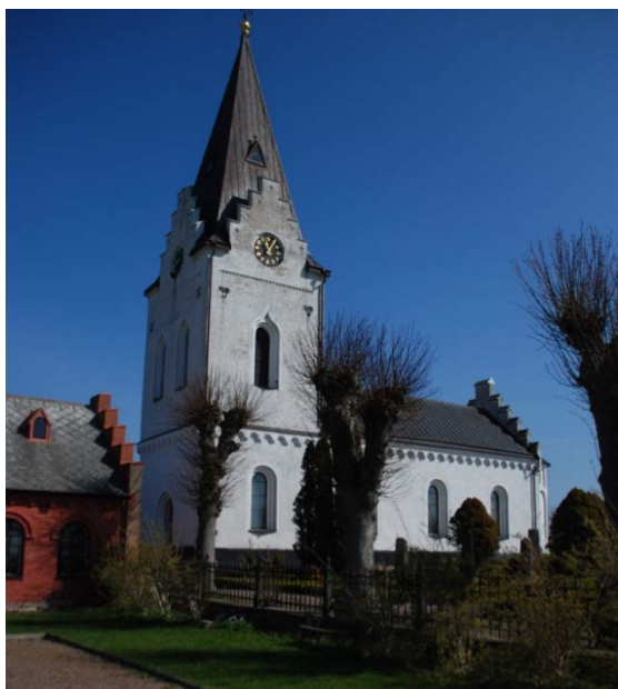
[1]: Kyrkan från sydväst

Kyrkan har tre entréer, en huvudingång i väster genom tornet, en prästingång genom absiden och en källardörr till teknikrummet under koret. Huvudporten har en rundbågig, tvåsprångig omfattning. I öppningen sitter en pardörr i ek av ramverkstyp, utvändigt klädd med stående panel och invändigt med åtta dekorativt utformade fyllningar. Dörren är beslagen med svartmålade smidesgångjärn och har ett trycke av gjuten mässing. Ovan dörren sitter ett lunnettfenster av gjutjärn. Dörren till sakristian är gjord 1994 med den dåvarande dörren som förlaga och tillvaratar dess gjutjärnsbeslag. Utvändigt är dörren klädd med brädpanel, invändigt är den fanerad.