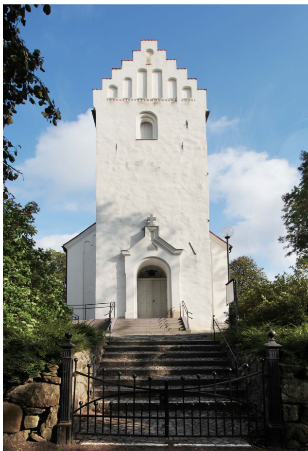
Tornet är kyrkans äldsta del och är till stora delar bevarat sedan medeltiden.

Kyrkobyggnaden vilar sannolikt på en kallmurad gråstensmur. Troligen är samtliga murar uppförda i skalmursteknik, det vill säga med en yttre och en inre mur där mellanrummet fylls med bruk och överblivet stenmaterial. Vid murverksundersökningen 1974 återfanns återanvända sandstenskvadrar i långhusets murar. Även i korabsiden finns sandstenskvadrar, vilka använts som hörnstenar. Troligen har dessa tidigare varit delar i en portal eller omfattning. Bortsett från inslaget av återanvänd sandsten och tornets trappstegsgavlar, som är murade i tegel, består kyrkobyggnadens murar av gråsten.