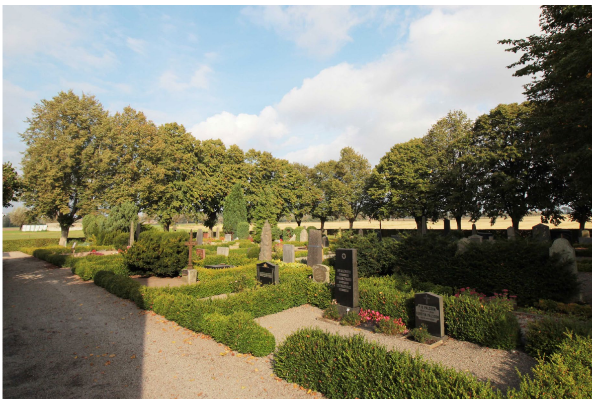
Den nya kyrkogården som anlades 1886.

Den nya kyrkogården är planlagd efter ett strikt rutnätsmönster med grusade gångar och gravkvarter, med gravarna placerade i öst-västlig riktning. Kyrkogården har tydliga drag av äldre lantkyrkogård med gårdsgravar knutna till byns gårdar. Kvarteren delas in av låga buxbomshäckar. Den östra delen av den nya kyrkogården är ännu inte belagd med gravar och är gräsbevuxen. Kyrkogården omsluts av en trädkrans av lind samt en klippt bokhäck.