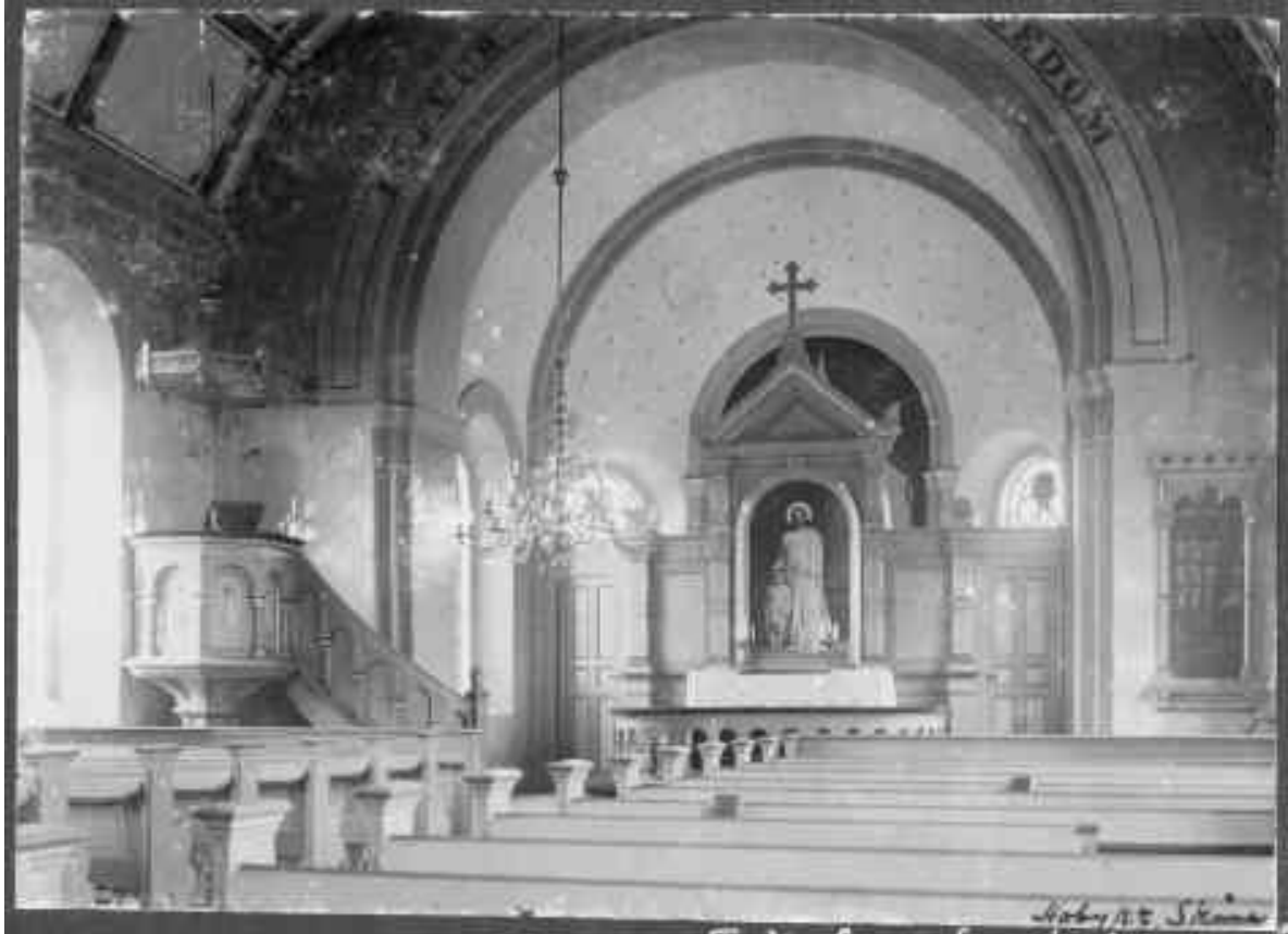
Innan taken och koret målades om var de försedda med dekorationsmålerier.

försågs med dekorativa målerier. Även korabsidens hjälmvalv pryddes av dekorativt måleri medan tribunbågen och korfönstrens omfattningar gavs en avvikande färgsättning.