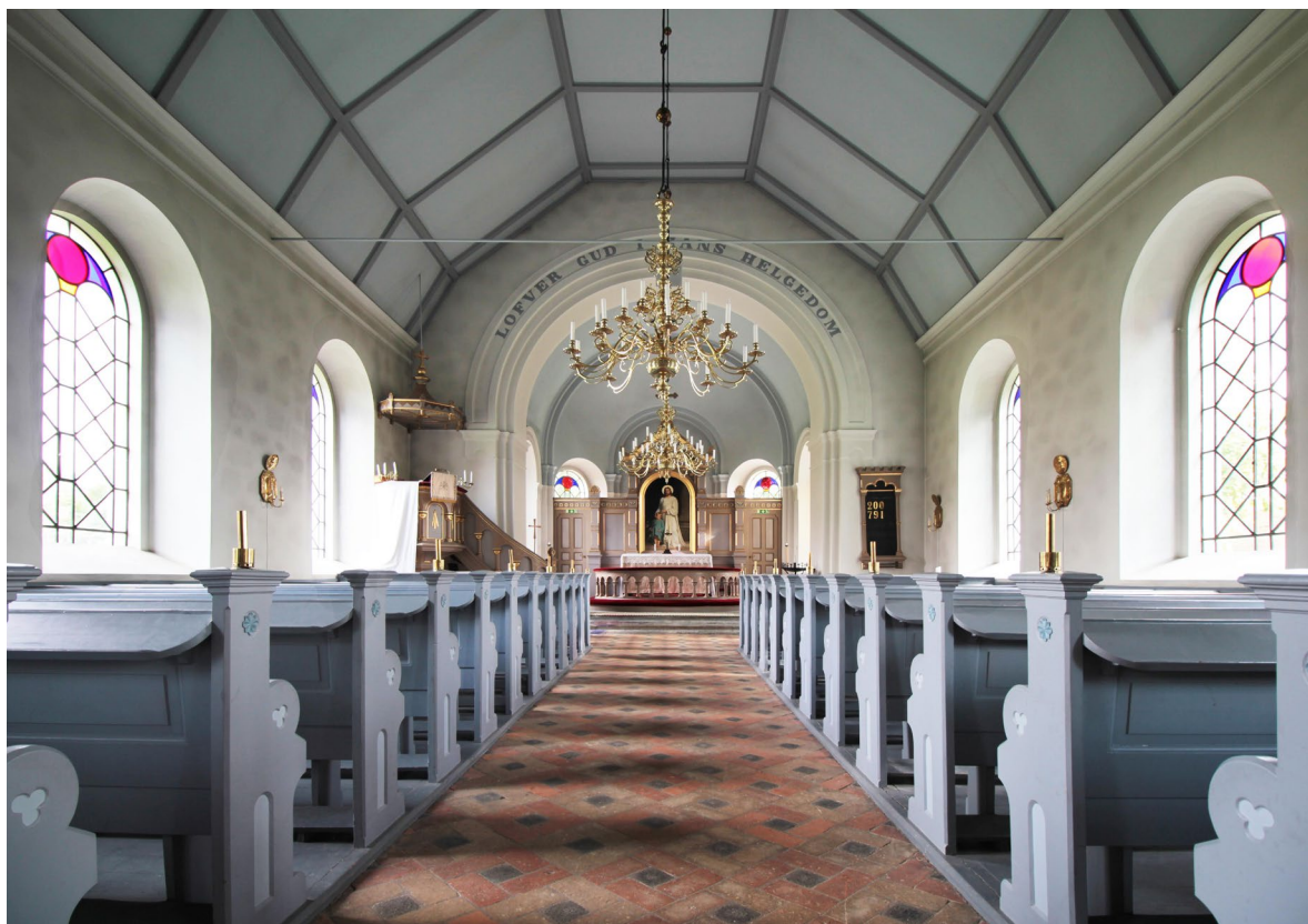
Kyrkorummet sett åt öster.

Kyrkorummet nås genom tornets västportal som leder in i vapenhuset. Längs rummets norra sida löper en trappa som leder till läktaren och vidare upp i tornet. Golvet