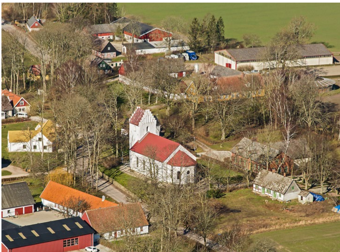
Flygbild över Västra Hoby tagen från sydöst, 2014.

I november 1676, knappt en månad innan det för det dansk-svenska kriget avgörande slaget vid Lund, utspelade sig en viktig händelse i Västra Hobys historia. Under befäl av den svenska konungen Carl XI befann sig en här på marsch mot Malmö. För att nå dit tvangs hären att ta sig över Löddeå (Kävlingeån). Höstregnet hade gjort ån bred,