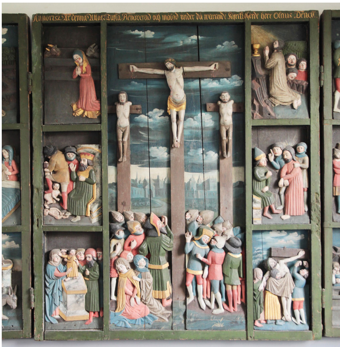
I korpus finns en stor Golgatakildring som omges av sex mindre scener.

att skåpet tillverkades i Skåne under senmedeltid, troligen under 1400-talets mitt. Med anledning av bristen på lokal produktion av altarskåp i Skåne under 1400-talet samt "scenernas summariska detaljgestaltning" och "skåpets rustika konstruktion", menar konsthistorikern Lennart Karlsson att det istället sannolikt rör sig om en kopia av ett senmedeltida altarskåp. Vad man med säkerhet vet är att altarskåpet renoverades och målades 1752 av dåvarande kyrkoherde Olaus Penell.