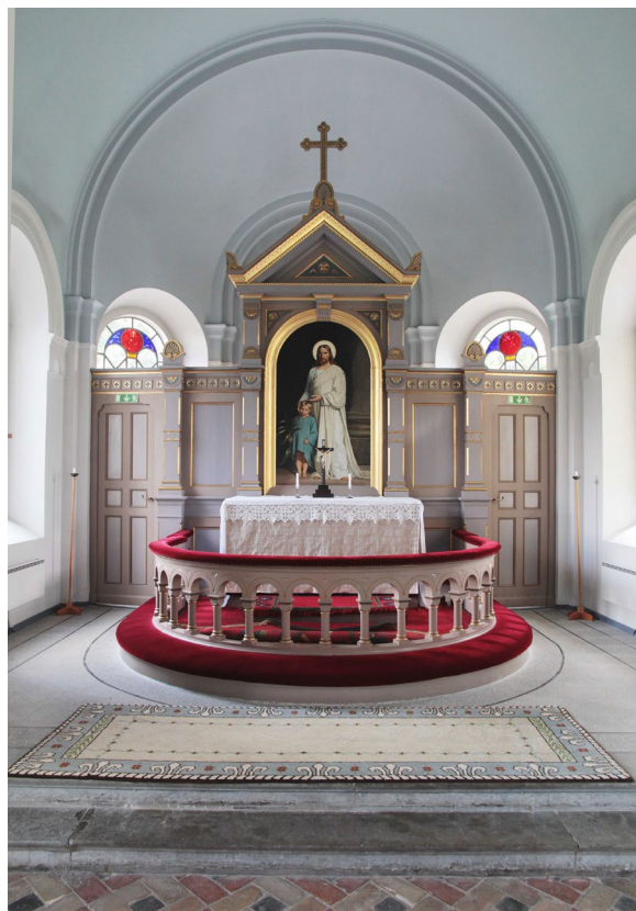
Koret med altaranordning och skrank mot sakristia.

Tornet har tre våningar samt klockvåning. I mitten på den tredje våning står klocktrampmaskinen som användes fram till det att man fick elektrifierad klockringning 1967. Klockbocken återfinns på klockvåningen högst upp och är i huvudsak tillverkad i ek. I klockvåningen finns flera dragbjälkar i ek, vilka sannolikt är medeltida.